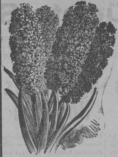
Jacintos dobles de Holanda

Arboles frutales y de adorno para Jardines y Macetas