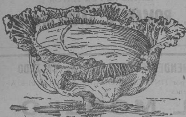
Repollo grande de Milán

Acelgas, Rabanitos y toda clase de hortalizas. Forrajerías, Sorgo azucarado, Sorgo del Sudán, Mostaza, Alfalfa, Remolacha, Trebó, Hierba para prados.