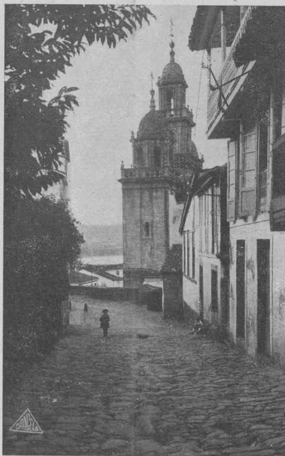
Puente deume. — Torres de la Iglesia parroquial

Como en otros lugares de la región gallega,