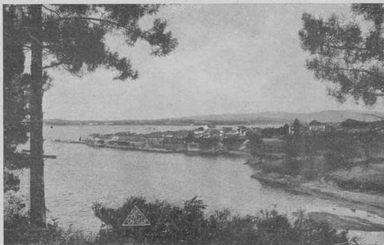
Ría del Ferrol. - El pintoresco pueblecillo de El Seijo

ensueño; los prados temblorosos bajo la boira y los girones de cielo gris unidos a la tierra por largos hilos de lluvia. Corredoira es lo escueto, lo estilizado; el pasmo ascético del Santiago milenario, la tortura espiritual de la Ciudad Santa, de la Compostela heroica, hogaño abatida por su misma grandeza sin objeto, pero donde el alma inquieta y avizora de la raza, tiembla de intuición y de infinito. Llorens es el mar en verano, la costa pródiga, rica y algarera, que todo lo paga con su hermosura fanfarrona y dispendiosa. So-