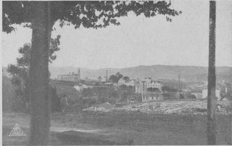
Orense. - Lugar del Couto

clusivamente gallego, une su carácter especial que le da cierto empaque ciudadano dentro de sus pujos industriales y de sus carac-