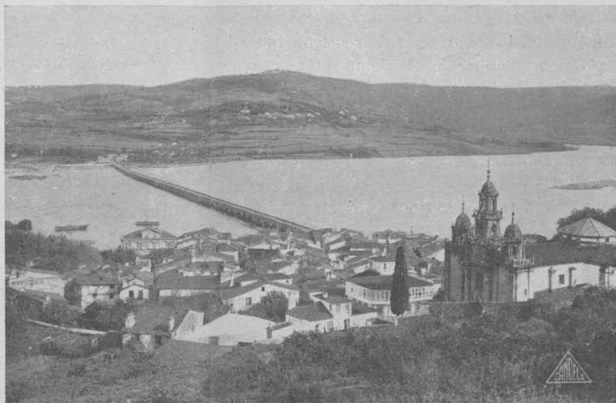
Vista parcial de Puentedeume

co kilómetros de La Coruña, por carretera.»