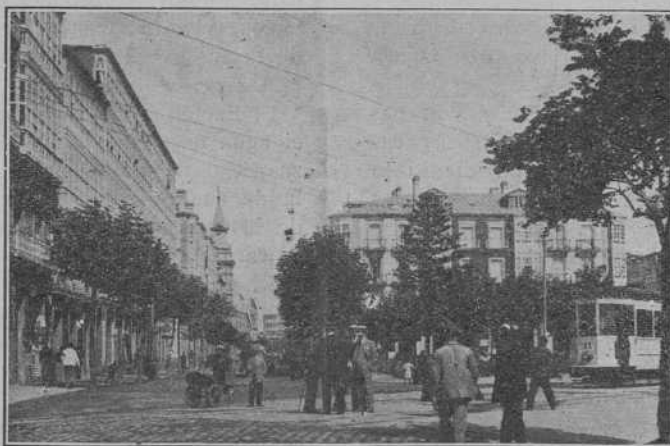
PLAZA DE ORENSE EN LA CORUÑA

PARA PEDIR COÑAC, BASTA DECIR: UN DOMECCQ