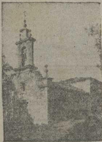
Nuestra casa: la Parroquia

Siempre habrá pobres entre nosotros (Mar. XIV-7) y sus palabras no otros. Así lo afirmó el Divino Profeta (Mat. XXIV-35). Tal afirmación hace cierta la contraria: si siempre ha de haber pobres, también lógicamente habrá siempre ricos. Y, en verdad que sólo así puede concebirse la Humanidad caída, integrada por aquellas dos clases sociales: ni todos ricos, ni todos pobres; sino ricos y pobres en fraterna armonía; ricos y pobres en bienes espirituales y corporales igualmente necesarias para el hombre. Así cuando se nos dice que "no sólo de pan vive el hombre" (Luc. IV-4), se admite que también vive de pan, y la mejor de las oraciones pide al Padre "el pan nuestro de cada día", pan para el cuerpo y para el alma, como explica el Catecismo.