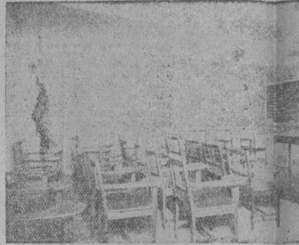
UN AULA DEL INSTITUTO DIOCESANO