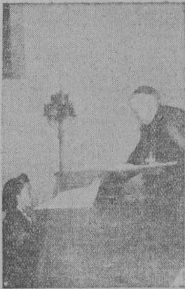
Distribución de diplomas

Proximos todos lo que esté de nuestra parte para nutrir los cuadros de alumnos en este Centro, y una vez fuertes, extenderlos entre los otros la palabra de luz que disipe las tinieblas en que se dejen muchas almas a nuestro albedrío.