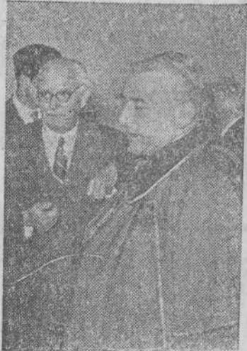
Su Emcia. el Cardenal Arzobispo conversa con D. José María Pemán que pronunciará el Pregón de la Misión coruñesa (Vea en pág. centrales un amplio resumen del Discurso de Pemán)

Santiago, 6 de febrero de 1955. † FERNANDO, Cardenal Quiroga Palacios.—Arzobispo de Santiago.