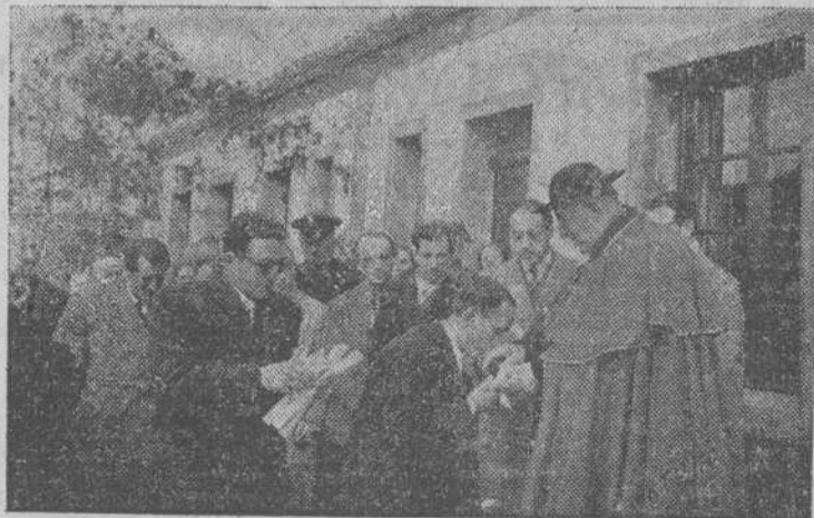
Su Eminencia entregando la llave de una de las viviendas construidas en el Monte de Conjo a uno de los obreros que la ocupará con su familia.