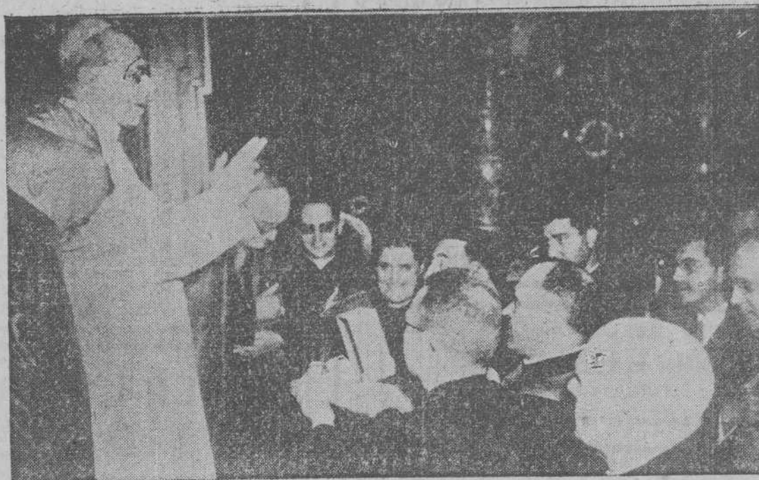
El Cardenal Primado y el Cardenal Arzobispo de Santiago, que presidían la Comisión Nacional de homenaje al Papa, entregaron a Su Santidad la primera piedra simbólica del nuevo Colegio Español de Roma, regalo del pueblo español en el LXXX aniversario de su natalicio