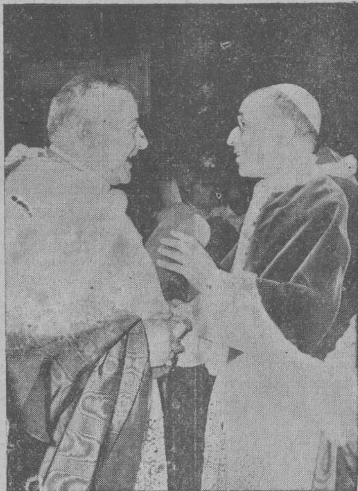
Durante la audiencia especial concedida por Su Santidad el Papa Pío XII a los preladados españoles y a la Junta Nacional Española de Homenaje al Santo Padre, fué impresionada la fotografía que reproducimos, y en la que el Sumo Pontífice aparece recibiendo la felicitación de Su Eminencia Reverendísima el Cardenal Arzobispo de Santiago, doctor don Fernando Quiroga Palacios

CIUDAD DEL VATICANO, 11.—La Basílica de San Pedro, engalanada con tapices en damasco rojo que datan del Pontificado del Papa español Alejandro VI, ha sido escenario esta mañana del punto culminante de las celebraciones con motivo del décimo quinto aniversario de la elección y coronación del Cardenal Eugenio Pacelli como Sumo Pontífice, el 12 de marzo de 1939, con el nombre de Pío XII. Estas conmemoraciones, que se iniciaron el pasado día 2 —aniversario del nacimiento de Su Santidad y de su elección para el Trono Pontificio— han revestido notable sencillez por expreso deseo del Padre Santo, quien hizo constar su voluntad de que la celebración de esta efeméride se efectuara principalmente con oraciones y obras de caridad, dirigidas a todos aquellos que están necesitados y sufren persecución por la fe. El aniversario de la coronación —12 de marzo de 1939— ha sido trasladado al domingo, con el fin de que todos los fieles del mundo pudieran participar en espíritu, y a través de la radio y la televisión, en las solemnidades de la Basílica de San Pedro. Al terminar la solemne misa oficiada en el primer templo de la cristiandad, el Padre Santo ha impartido su bendición "urbí