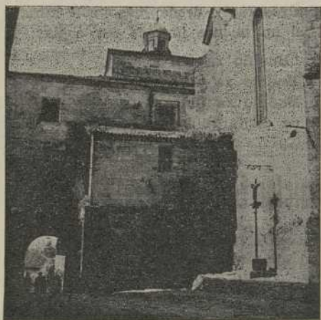
TUY.—Pasadizo de la Misericordia. Un emotivo rincón de la vieja Ciudad. Crucero del siglo XV.

¡¡TUDENSES!!: El progreso de tu Ciudad solo puede salir del trabajo y el esfuerzo de sus hijos.