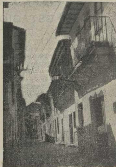
Del Tuy antiguo CALLE DE ABAJO