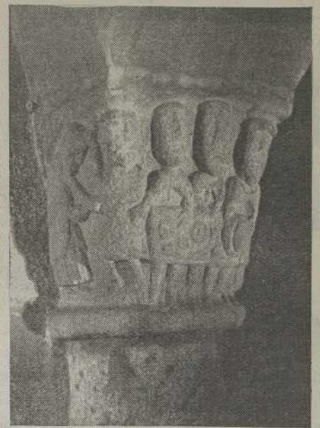
TUY. — San Bartolomé. Uno de los maravillosos capiteles. (Siglo X).

Por el año 1102 ocupa la sede tudense D. Alfonso II, que recibe de manos del Arzobispo D. Diego Gelmírez las reliquias de San Fructuoso, San Silvestre, San Cucufate