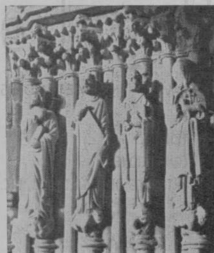
TUY. — Estatuaria lateral del Pórtico de la Gloria de la S. I. Catedral.

Manos a la obra. No olvidemos la frase de un conocido industrial hotelero de la Costa del Sol: "A más hoteles más trabajo para todos".