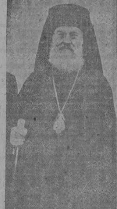
ATENAS, 5.—El Regente de Grecia, Arzobispo Damaskinos, ha dimitido, según anuncia la Agencia Reuter.

La dimisión fue enviada cablegráficamente al Rey Jorge de Grecia, que se encuentra en Londres, inmediatamente después que Damaskinos tomó juramento al nuevo Gabinete.—(EFE).