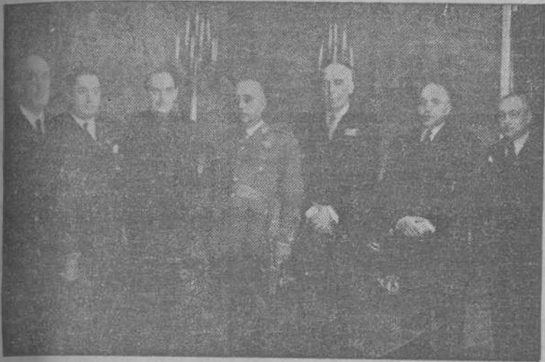
S. E. el Jefe del Estado, con los miembros del Sindicato Nacional del Papel, Prensa y Artes Gráficas, en comisión integrada por el Jefe nacional y representantes de las Industrias encuadradas en el Sindicato. - En la foto inferior, el Caudillo con la comisión de patronos empresarios de las minas de carbón y el Jefe nacional del Sindicato del Combustible.