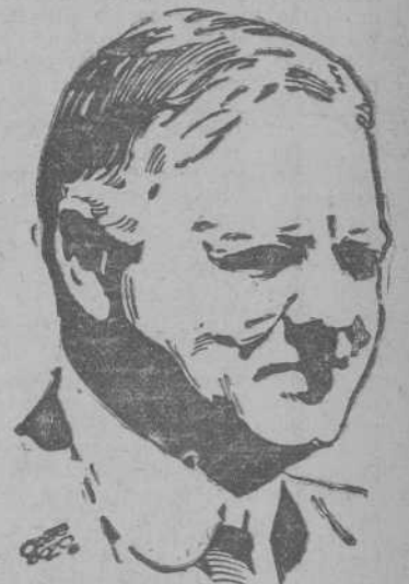
HOOPER ex Presidente de Estados Unidos