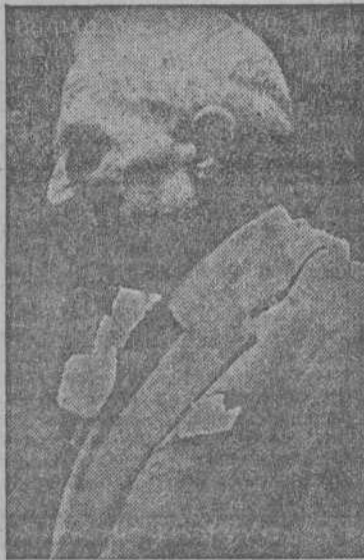
El Presidente italiano De Nicola

CIUDAD DEL VATICANO 31.—Esta mañana el Sumo Pontífice Pío XII ha recibido en visita oficial a S. E. Enrique de Nicola, jefe provisional del Estado italiano. El presidente venía acompañado de De Gasperi, presidente del Consejo de Ministros y secretario de