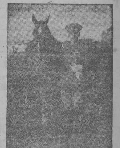
Capitán Ponte, con "Añoer de Tajo", ganador de la Copa de la guarnición