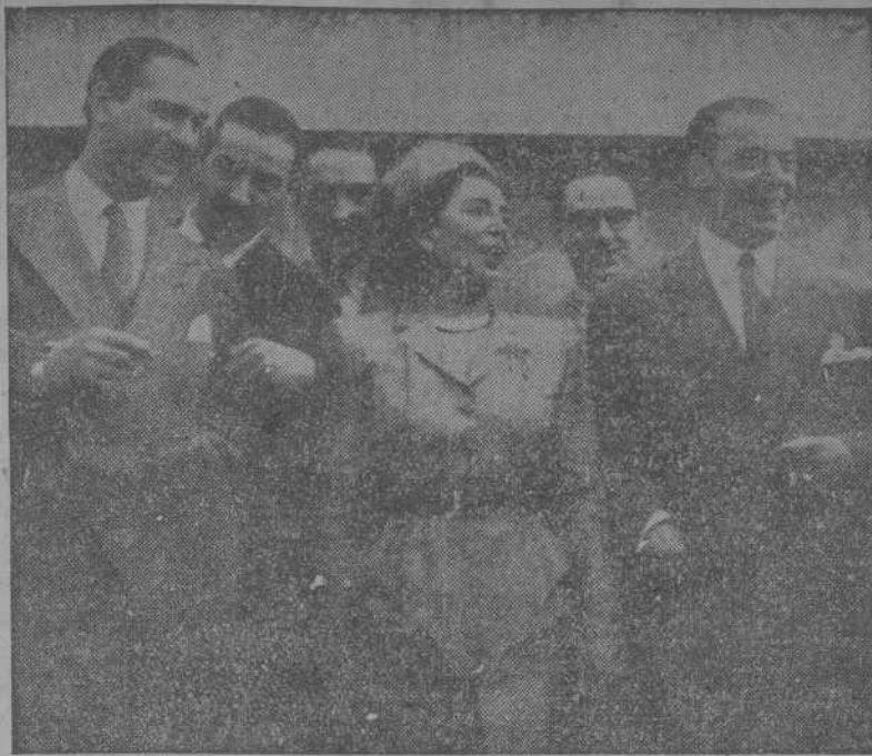
La actriz, con su esposo y otros viajeros, momentos después de desembarcar. (Foto CIFRA).