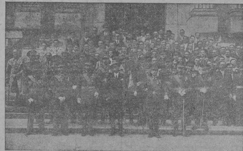
Los caballeros mutilados de guerra, que ayer conmemoraron la festividad de su celestial Patrono, el Arcángel San Rafael

BARCELONA, 24.—En los Hogares donde están acogidos varios niños polacos, puestos bajo la protección del Gobierno español, se ha celebrado esta tarde una fiesta infantil en honor de los 40 niños que mañana partirán para su país, vía Génova, a bordo del "Ciudad de Valencia", por haber sido reclamados por sus padres que han aparecido. El acto constituyó una muestra de gratitud hacia el país que tan cariñosamente les ha cobijado. Se dieron vivas a Franco y a España en perfecto español, ya que la mayoría de los pequeños hablan nuestro idioma.—(CIFRA).