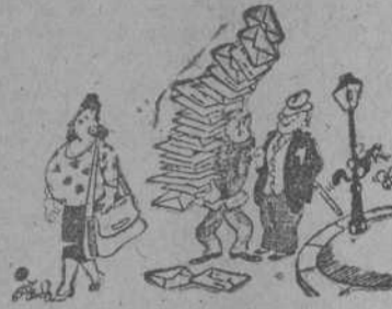
CORREO: Por Miranda

—¿La Gran-Vía? —Sí, señor. Sigán por ahí "derechos".