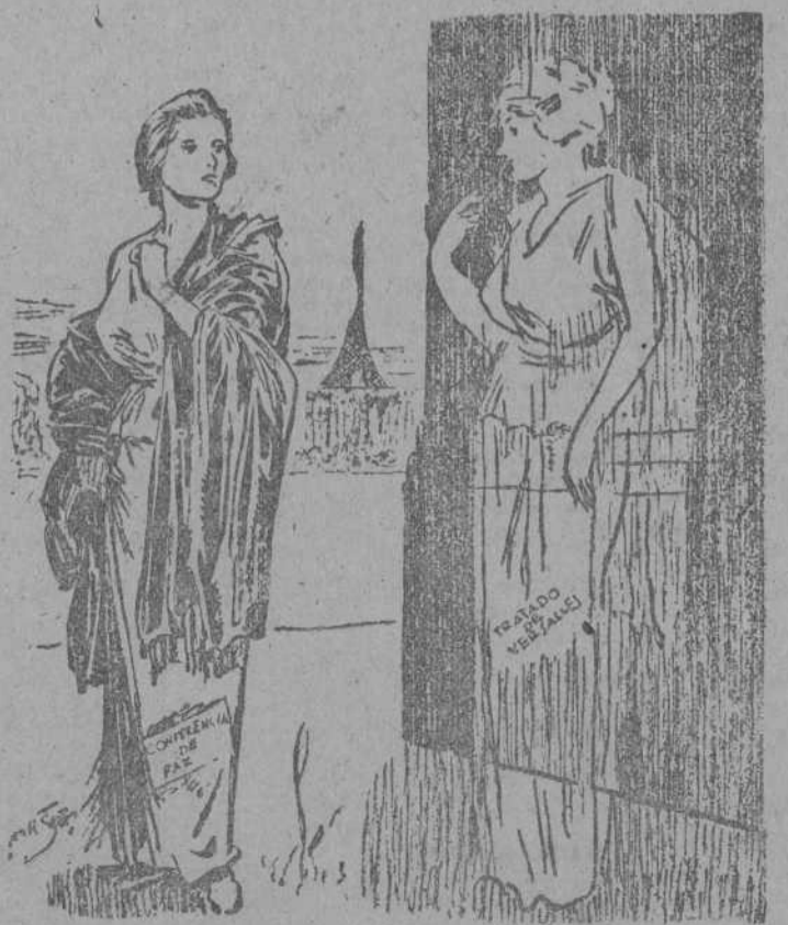
"¿Puedo quedarme un rato por aquí, como una advertencia?"

MADRID 24.—El decreto que mañana publicará el "Boletín Oficial del Estado" creando, bajo la inmediata dependencia de la Presidencia del Gobierno, la delegación especial del Gobierno para la inspección del cumplimiento de las disposiciones sobre tasas y abastos, faculta al delegado especial, que tendrá la categoría administrativa de Director General y actuará en todo el territorio nacional para intervenir con plena autoridad en función inspectora en cuantos organismos tienen a su cargo funciones relacionadas con los abastecimientos y la represión del mercado clandestino. La misión de este delegado será vigilar estrechamente el funcionamiento de todos los organismos que intervienen en esta actividad, dar cuenta de las deficiencias observadas, excitar el celo de las autoridades y sus agentes para exigir el exacto cumplimiento de las disposiciones vigentes y proponer al Gobierno las medidas que juzgue más convenientes para el rápido remedio de las deficiencias y la mayor eficacia en la coordinación de los distintos servicios. La delegación actuará igualmente de oficina de amparo de quejas de los particulares, y propondrá al Gobierno las medidas para su corrección. El personal que en el mínimo indispensable sea necesario a la Delegación será proporcionado por los organismos de la administración y sostenidos por los mismos, sin que la creación del nuevo organismo ocasione gasto alguno.