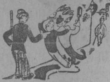
NOTA. Por Miranda

—¿La Gran-Vía? —Sí, señor. Sigán por ahí "derechos".