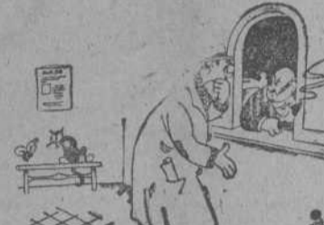
"CLARIDAD": Por Miranda

—¿Así haces el reparto? —¿Qué quieres que le haga! Mientras la cartera está de moda, quien la lleva es mi mujer!