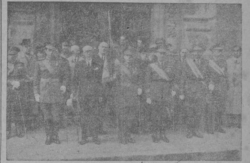
El Capitán General, don Salvador Múgica Buhigas, con las autoridades y representaciones que concurrieron a la solemne misa celebrada en la Iglesia del Sagrado Corazón

La ceremonia religiosa celebrada en La Coruña fué presidida por el Capitán General y otras autoridades