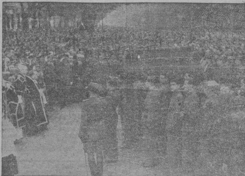
MADRID.—Un momento del entierro. Los féretros son llevados a hombros de los compañeros de las víctimas. El sepelio, al que concurren representaciones nutridísimas de todas las clases sociales, constituyó una impresionante manifestación de duelo.

Barco inglés partido en dos Conducía un valioso cargamento de regalos de Navidad