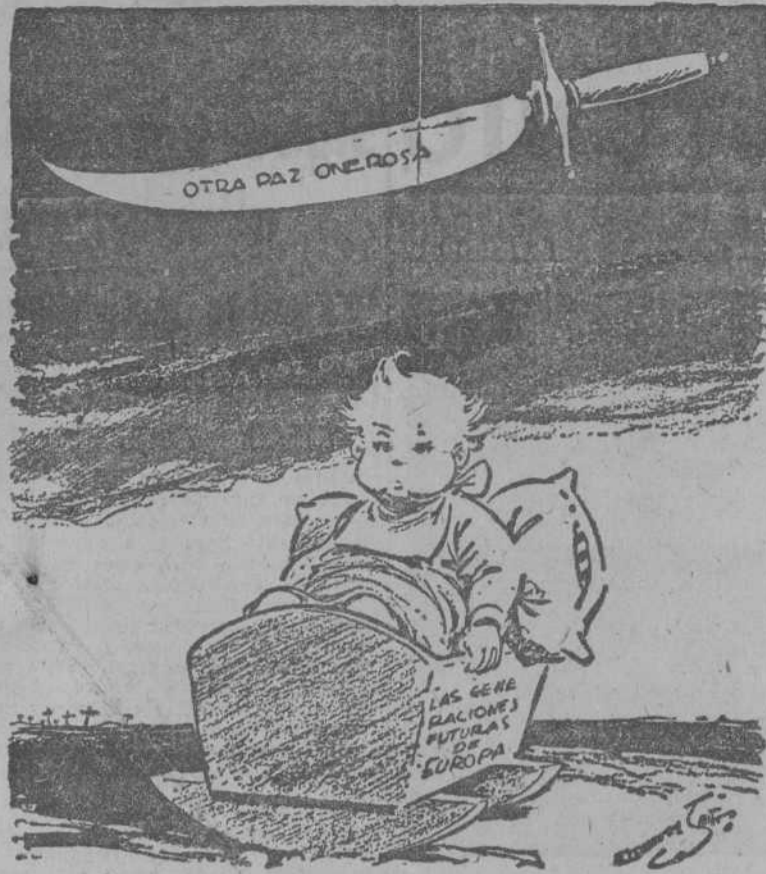
LA ESPADA DE DAMOCLES

En la última Asamblea Constituyente los M. R. P. eran el partido más numeroso. Ahora tropiezan con la oposición de un grupo considerable de franceses que, saliendo de sus filas se dirigen hacia De Gaulle o hacia el P. R. L. (Partido Republicano de la Libertad), que no transige con el marxismo. En cambio, socialistas y comunistas cambian poco sus posiciones. Todo depende, pues, de que el francés medio se dé cuenta de que el día de hoy es trascendental para la política de su país y acuda sin demasadas abstenciones a las urnas. Si no es así, esperamos muy movidos con la futura Cámara que hoy se elija. Porque de ella saldrá quien ha de gobernar. Y el que gobierna tendrá las espaldas bien cubiertas. Que la nueva democracia parlamentaria no es ya la de la vieja oratoria donde con discursos podían cambiarse decisiones gubernamentales. Ahora luchan partidos disciplinados y sólo cuentan votos. Firmemente se pasa por encima de todo, con justicia o sin ella, con tal de seguir adelante la consigna del partido. Y la nueva Constitución francesa permite más que ninguna otra de las anteriores la dictadura de un partido sobre los demás.