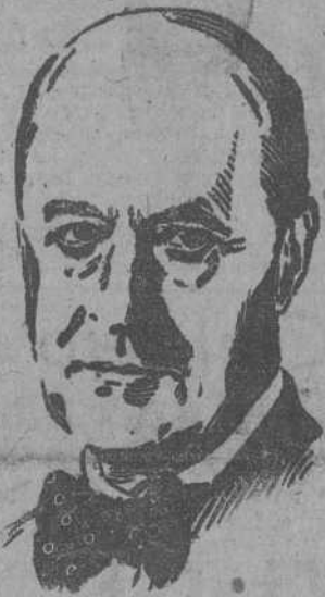
Don Domingo de las Bárcenas, embajador de España en Londres

LONDRES, 11.—El embajador de España en Londres, Sr. Bárcenas, ha declarado a un redactor de la Agencia Reuter lo siguiente, al comentar la recomendación del Comité Político de la Asamblea de la ONU para que se retiren las representaciones diplomáticas de dichas naciones en Madrid: "La hostilidad hacia el Gobierno español sólo produce el efecto contrario al que buscan nuestros enemigos. Sólo sirve para herir el amor propio del pueblo español y para reforzar sus sentimientos de unidad nacional. España nunca tolerará la intromisión en sus asuntos internos por potencias extranjeras, algunos de cuyos Gobiernos, de dudoso origen, tardaron muchos años en ser reconocidos. Sin duda, todos los representantes extranjeros en Madrid habrán facilitado a sus Gobiernos informaciones más completas y verdaderas sobre las recientes manifestaciones en toda España, que las descripciones de las mismas publicadas ahora en la Prensa."