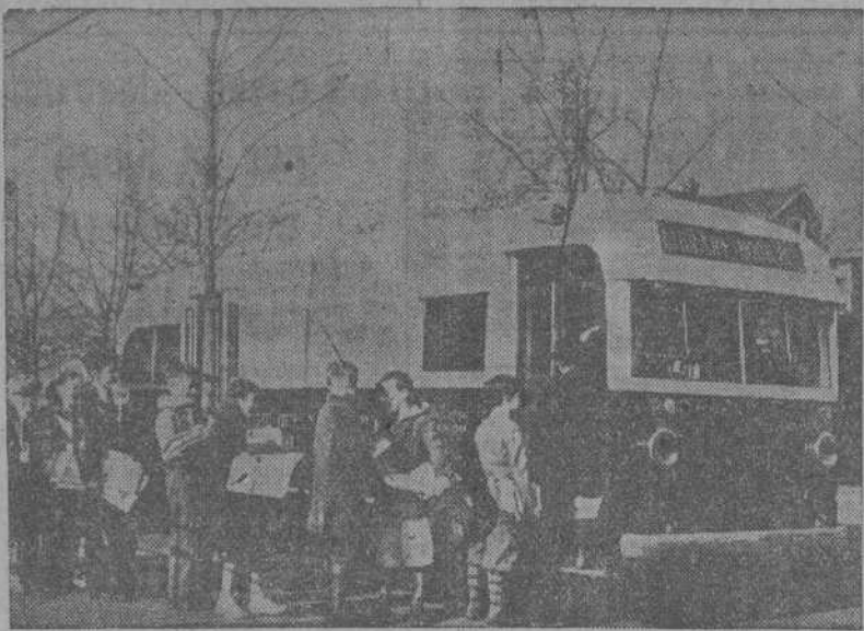
Un autobús-biblioteca infantil

En los Estados Unidos se está tratando actualmente de obtener el apoyo oficial para el servicio de bibliotecas ambulantes, que con tanta eficacia contribuyen a la difusión del libro en las zonas rurales.