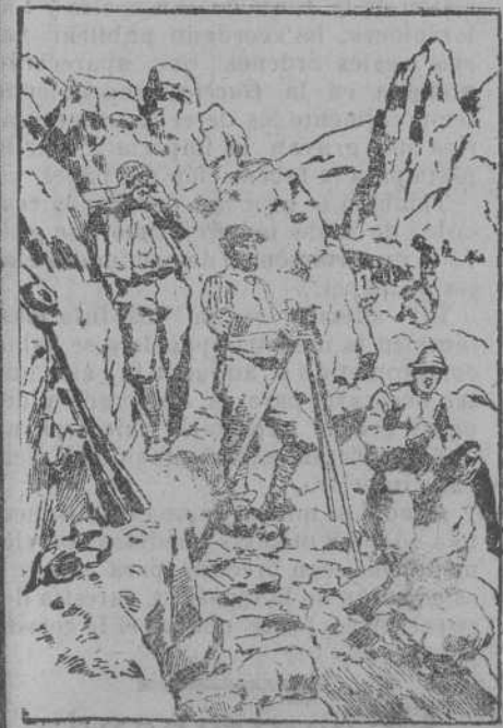
Oficial de alpinos austriacos transmitiendo órdenes por medio de telegrafía óptica.