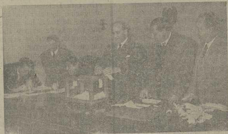
Una fase de Elecciones para Jefes de Sindicatos