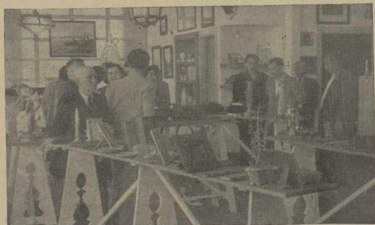
Grupos de visitantes

No cabe dudar de la brillantez que este Concurso-Exposición tuvo y que mereció por parte del público los mayores y más encendidos elogios, y que dejará por muy tiempo un grato recuerdo, pudiendo considerarse como uno de los mayores éxitos alcanzados en esta clase de certámenes.