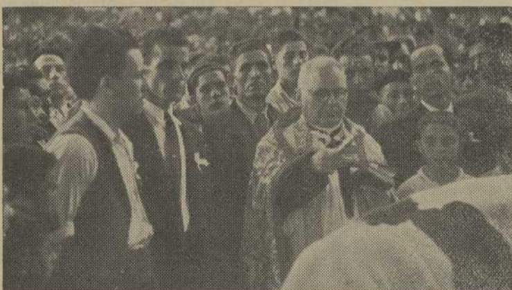
El párroco de Sárdoma bendice el ganado presentado

Se celebró con gran éxito en San Pedro de Sárdoma. Y se otorgaron importantes premios