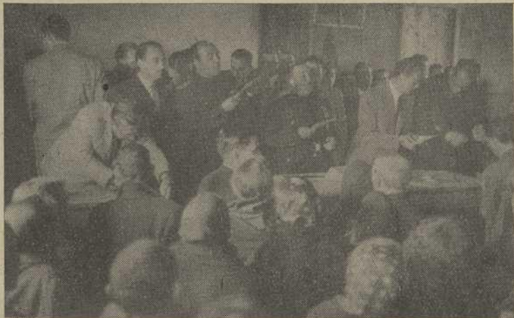
Entrega de Subsidios a los beneficiarios

Una vez recibida la bienvenida, seguidas las autoridades de enorme multitud, se encaminaron a la iglesia parroquial, en cuyo pórtico fueron recibidas por el cura párroco, párroco de San Adrián de Cobres y el