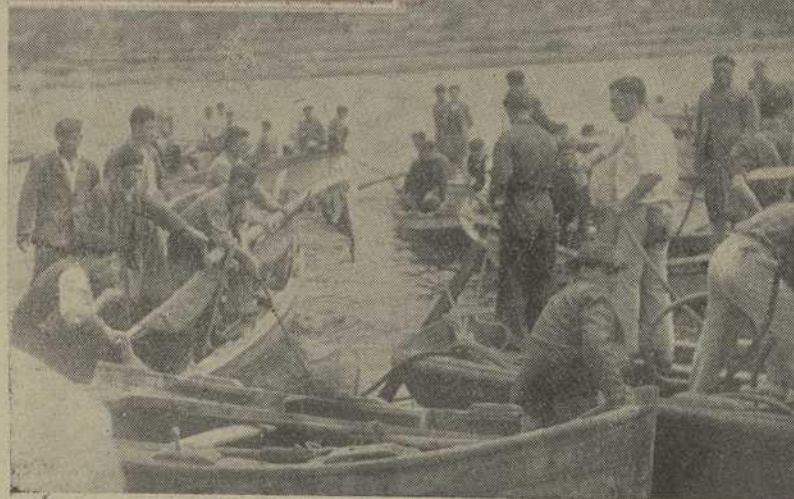
Dramático momento del rescate de los cadáveres al mar

por el Lugarteniente general de la Guardia de Franco, Gobernador civil y Jefe provincial del Movimiento —que desde su conocimiento del doloroso accidente, no había descansado un solo instante, llevando personalmente la dirección de todo lo que con este luctuoso hecho se relacionó e incluso presenciando el rescate de las víctimas y hasta tomando parte en los trabajos para ello—, y demás autoridades, representaciones, afiliados a la Organización y pueblo en general, advirtiéndose la presencia de numerosos empresarios y trabajadores de todos los puntos de la provincia.