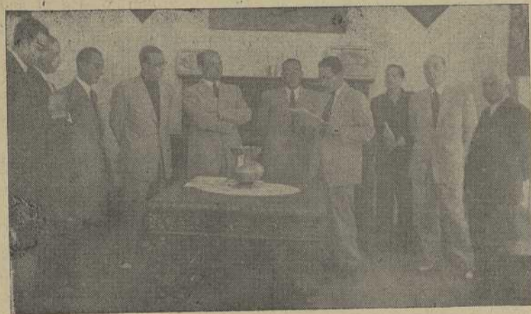
Ante la presidencia es leído el fallo del Jurado

Como final del espléndido Concurso-Exposición de Artesanía celebrado en Pontevedra, tuvo lugar el pasado día 22, el reparto de premios a los artesanos que habían sido galardonados por los trabajos con que a este certamen habían concurrido.