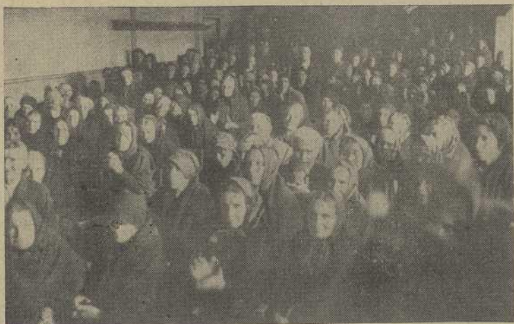
Un aspecto del salón durante la celebración del acto

Terminada la ceremonia religiosa, y a causa de la lluvia, el Gobernador civil, y demás autoridades y jerarquías provinciales y locales, se trasladaron al espacioso salón del cine, en el cual se iba a proceder a la distribución de los subsidios de vejez, y entrega de los correspondientes carnets, entre los agricultores ancianos, a quienes habían sido concedidos.