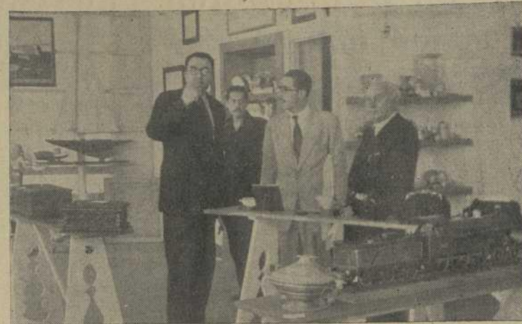
Miembros del Jurado del VI Concurso-Exposición Provincial de Artesanía

TRANSPORTES.—Rectificación a la Orden de 22 de Julio de 1950, por la que se dictan normas para la aplicación de las reducciones acordadas en los tipos tributarios del im-