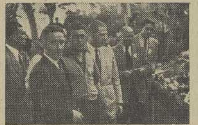
El Jurado examina los productos