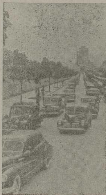
La comitiva por la Gran Vía del Generalísimo

delebró un vistoso y animado festival, al que asistieron las familias de los transportistas y que, dentro de la mayor animación y camaradería duró hasta avanzada la madrugada.