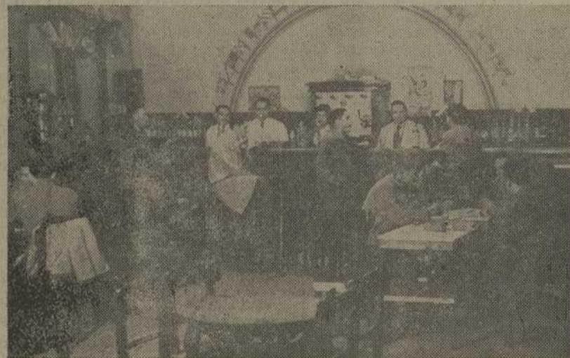
Arriba: Animado momento en el comedor a la hora de servirse la comida. — Abajo: El bar del Hogar

Publicábamos, en nuestro número anterior, un reportaje relacionado con el Hogar del Productor de Vigo, a través del cual pudieron apreciar nuestros lectores la importancia del mismo y, los elevados fines asistenciales que cumple, proporcionando medios a nuestros productores, para que en las horas de descanso puedan atender a sus necesidades materiales y a las exigencias del espíritu.