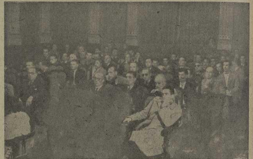
Vista parcial del Salón del Hogar del Productor durante el Pleno de la Asamblea Asistencial

A continuación, expresa su satisfacción, y se felicita por haber presidido la Asamblea, y termina animando a todos a que sigan trabajando, manifestándoles la absoluta