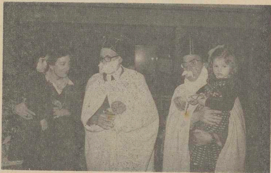
Los Reyes Magos en la Guardería del Patronato