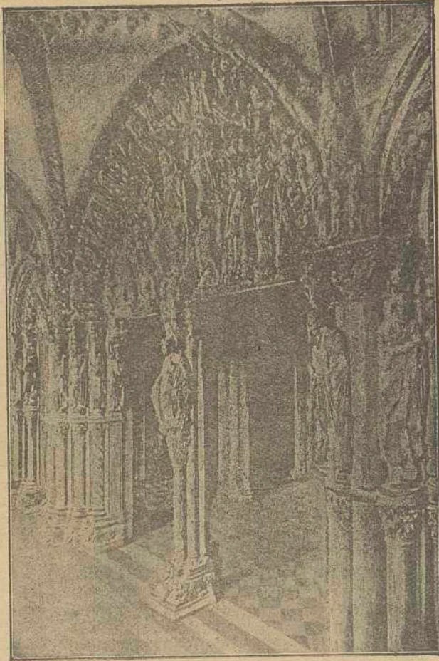
Real Basilica Compostelana. — Pórtico de la Gloria, obra excelsa del Maestro Mateo y el monumento iconográfico más importante del mundo. Por él hacen su entrada las Romerías Jubilares

Rivela , Meavia y Liripio , lindando con tierra de Montes, son del Patronato del Excmo. Cabildo, lo mismo que las de Sabucedo y Tabeirós (3).