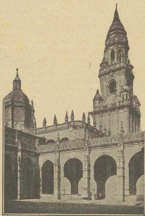
Claustro de la Real Basílica del Apóstol Santiago

El día no pudo ser más espléndido y el pueblo todo de Santiago, lleno de alborozo y de