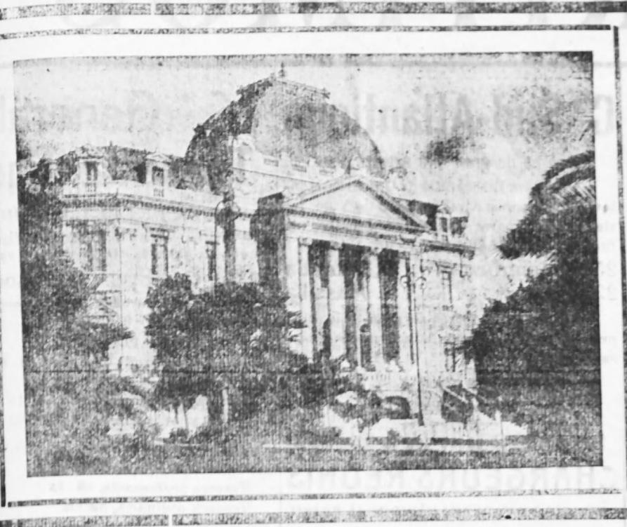
Palacio de la Escuela de Bellas Artes en Santiago de Chile, floreciente centro de cultura del cual fué director el gran maestro gallego D. Fernando Alvarez de Sotomayor.