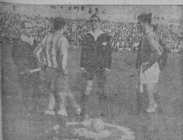
¿Caro? ¿Cruz? Los capitanes de ambos equipos, con el árbitro, en el momento de echarse la moneda al aire.

Antes de llegar al desastre, el Ferrol —ustedes lo han vis-