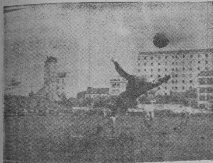
El primer gol del Deportivo. Rafa tira y García, nada puede hacer porque el balón llegue a la red, a pesar de su estrada.

Un penalty escamoteado por el árbitro y tres fallos de Mourelo a portero batido, cambiaron la tónica del encuentro. Pero al triunfo deportivista nada se puede objetar, ya que fué en todo momento merecido Crónica de KINSO