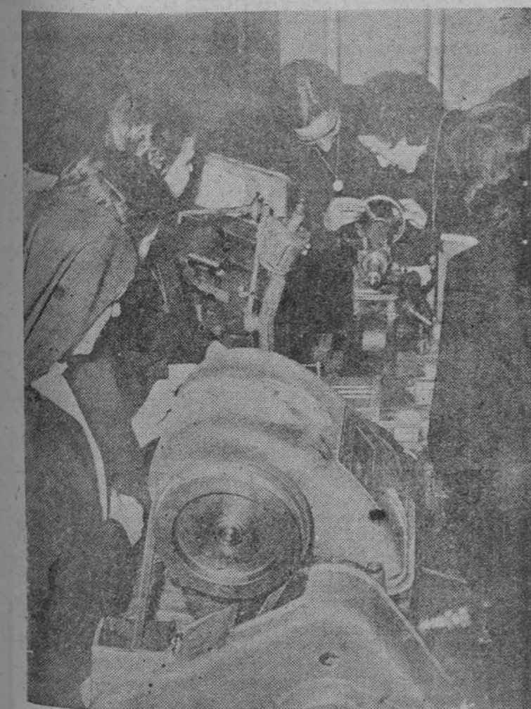
Este torno que manejan ahora estas monjitas no es el que comunica a la cámara con el mundo exterior. Se trata del torno mecánico en el que realizan prácticas las religiosas que cursan en Huelva el Bachillerato Laboral.