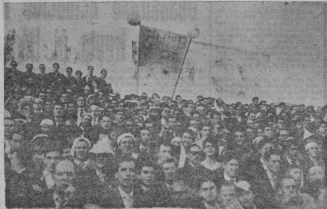
Una de las numerosas penias que la tarde del domingo aparecieron en el Estadio Rivera

una defensa muy coja. Aquí hay fallos ostensibles que conviene vigilar y aunque hubiese sido atrevido sacar frente (PASA A SEXTA PAGINA)