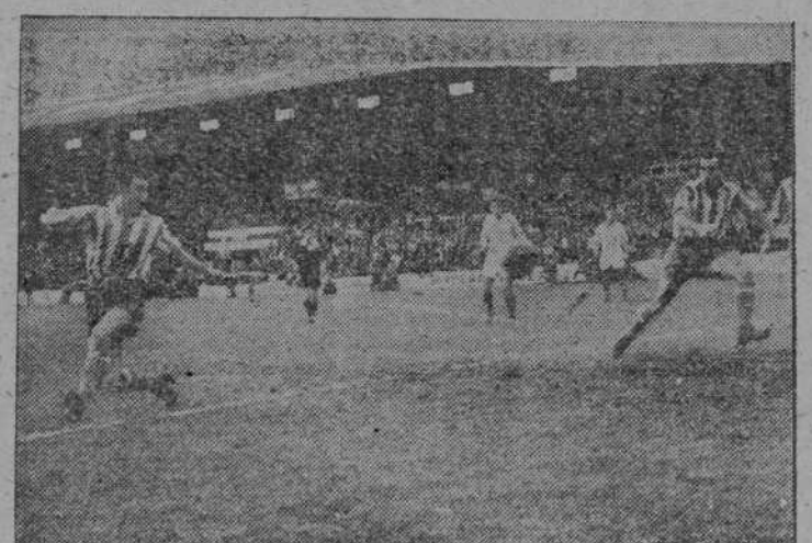
Primer gol del Celta, los defensores del Avilés no pueden hacer nada por detener el tiro