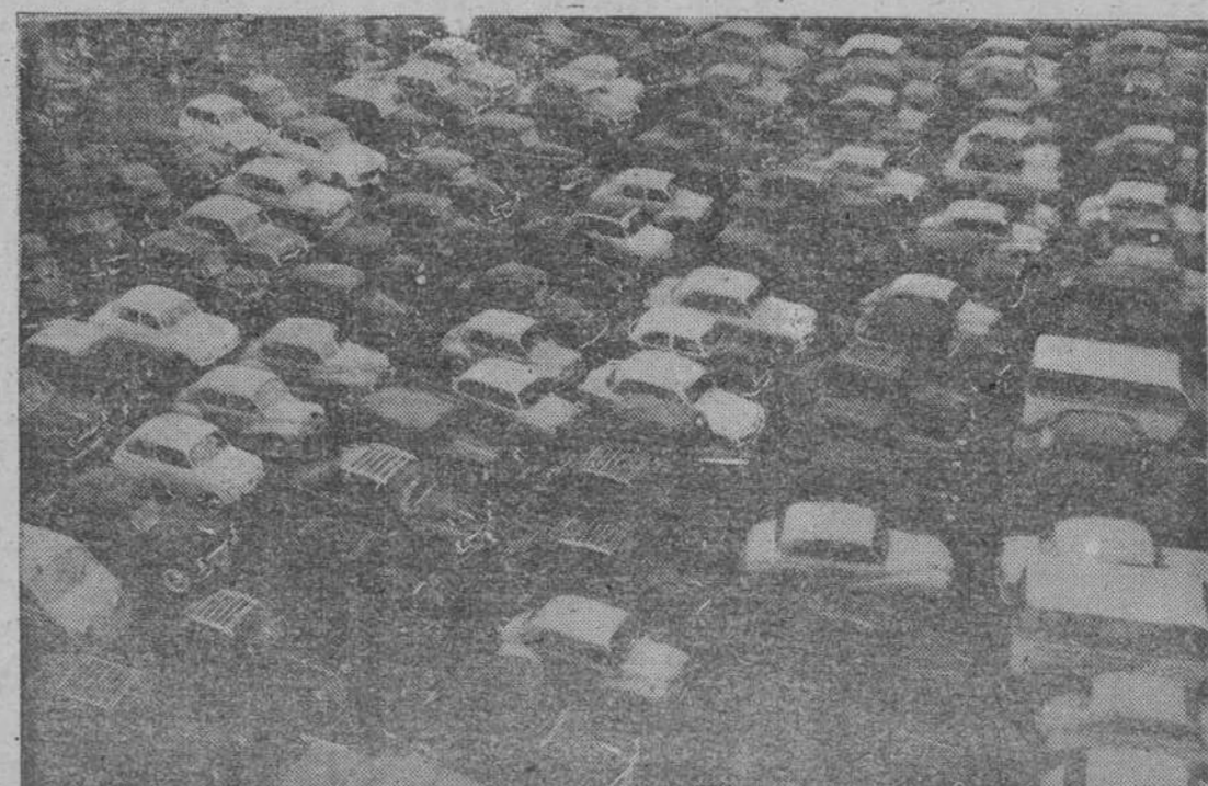
Fuera del Estadio, cientos de coches aparcados, dando una magnífica impresión de la gran afluencia forastera en el choque entre los eternos rivales

El Club Ferrol, por ahora, cuenta con dos buenos extremos: un magnífico volante y