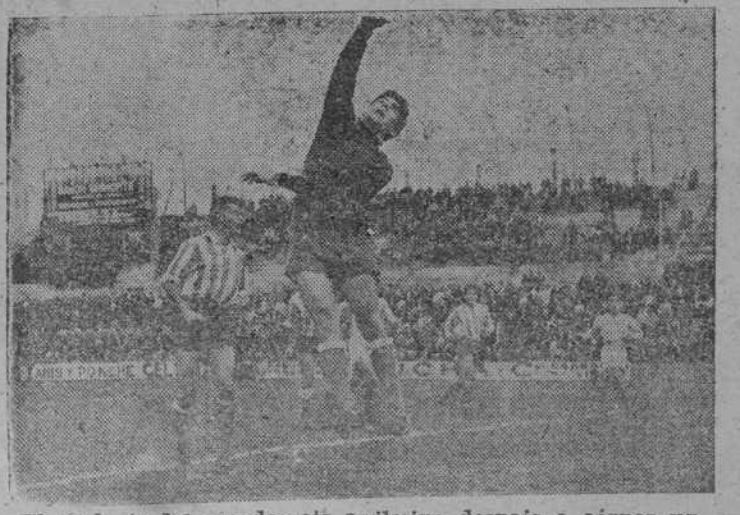
El suplente del guardameta avilesino despeja a córner un difícil tiro de Bayo

Si tiene usted algo que vender o que comprar, anuncie en la sección "ANUNCIOS POR PALABRAS".