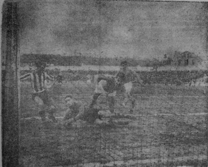
Zurría acosando la puerta contraria.

En el Estadio "Manolo Rivera" se jugó el domingo el partido de Segunda División, Baracaldo-Ferrol, que finalizó con el resultado de tres-tres.