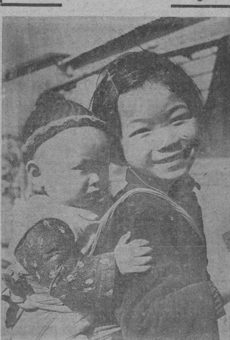
En general, los chinos que abandonan la China comunista se llevan consigo la familia entera, desde los ancianos a los más jóvenes. Mientras los adultos tratan de ganarse la vida y dar de comer a la familia, los pequeños son confiados a las niñas más crecidas

Llevará el nombre de San Juan de la Cruz, una calle de Río de Janeiro