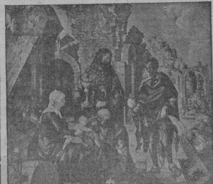
La historia de los Magos es una de las más hermosas del Santo Evangelio. Nos la refiere S. Mateo en el capítulo 2-1-12 de su evangelio: "Habiendo pues nacido Jesús en Belén de Judá, ret-