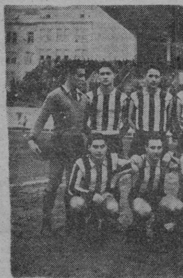
Club Baracaldo.

Con esto y otros errores de evidente favoritismo arbitral, como cortar muchos de los avances ferrolanos, señalar faltas al revés, etc., el señor Arrechea dejó un sabor amargo.