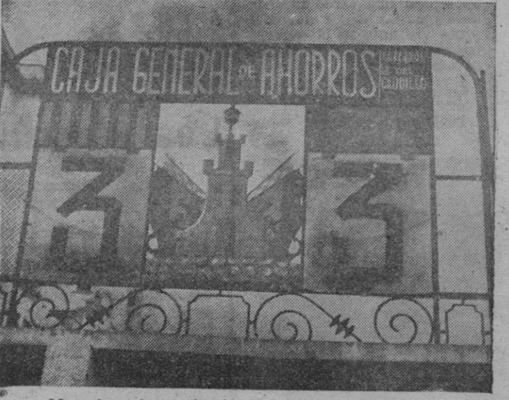
Marcador a la terminación del partido.

Baracaldo. — Fernández, Aitor, Zamacona, Ormazá, Aranzuz, Erafía; Flores, Bollnaga, Menchaca, Romero y Urruchurtu.