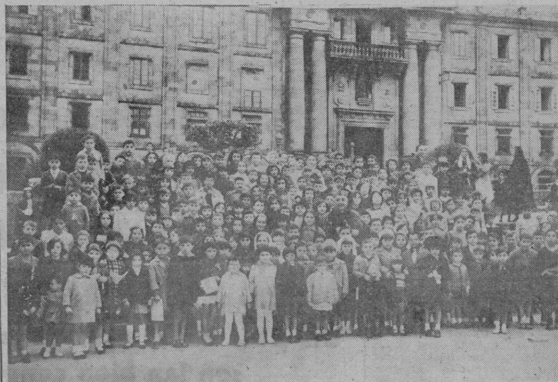
Coincidiendo con la conmemoración de la Batalla de Clavijo, y organizada por la Archicofradía del Apóstol Santiago, se celebró en la Catedral la presentación de niñas y niños al Santo Patron de España. La ceremonia estuvo presidida por Su Eminencia el Cardenal Quiroga. En la fotografía, el grupo de pequeños que participaron en tan emotivo acto.