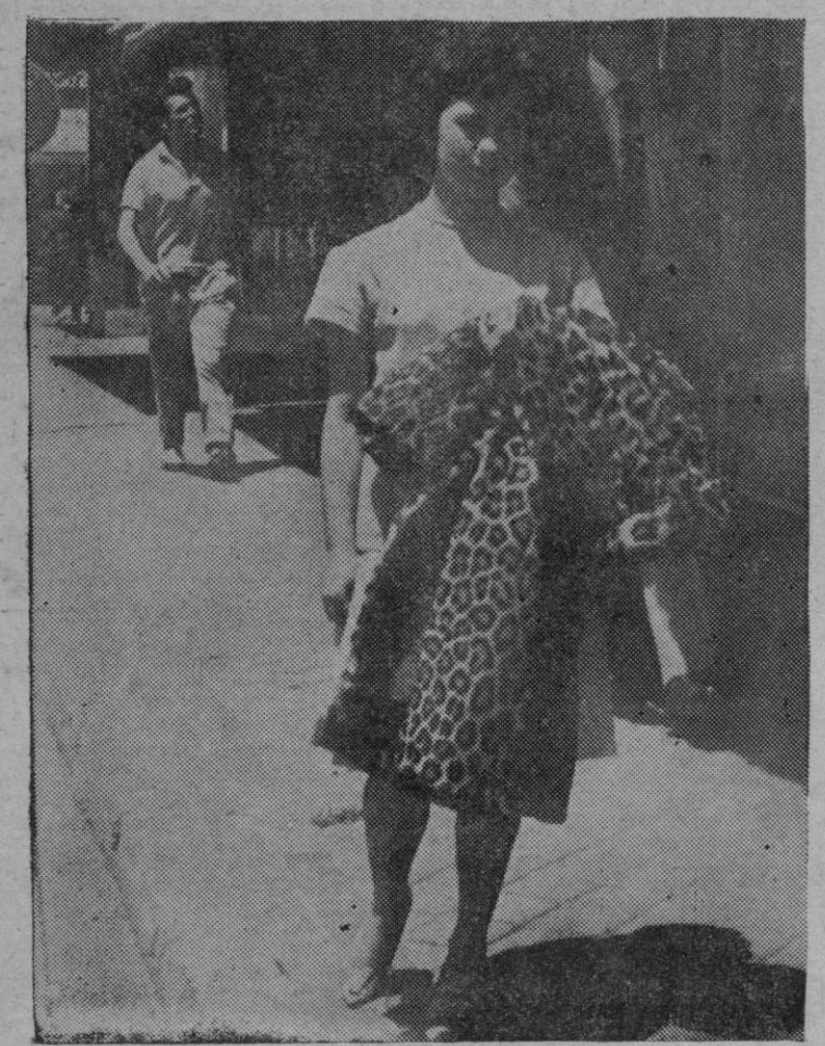
En verano, las peleterías madrileñas trabajan tanto o más que en invierno. (Foto EUROPA PRESS).