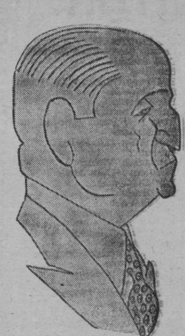
DON SANTIAGO BERNABEU

En la clasificación general por equipos, prosigue en cabeza: Geminiani, con cinco victorias; seguido del De Kimpe, tres victorias; — Afili.