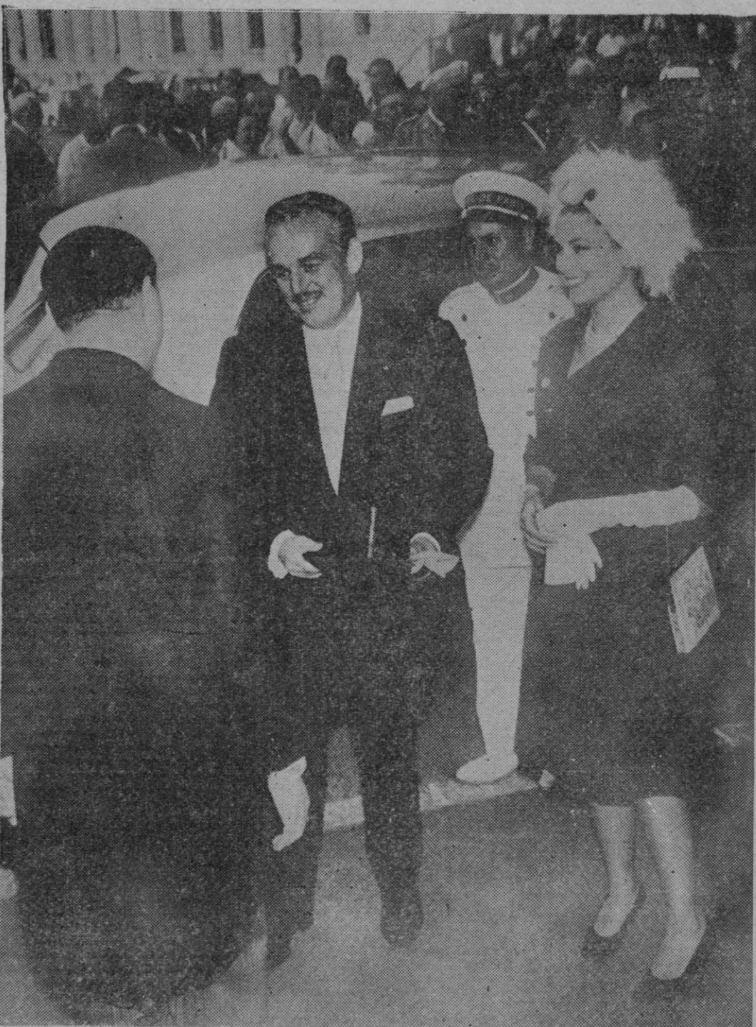
En Montecarlo se ha celebrado la boda Citterle - Borghese, a la que han asistido diversas personalidades, entre ellas el ex-rey Humberto de Italia y los príncipes de Mónaco, a los que puede verse a la llegada a la iglesia para asistir a la ceremonia.