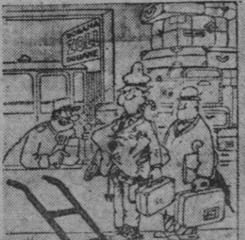
—¿De modo que no tiene nada que declarar?

Ojalá se vendan los libros, aunque sea por sus coquetías femeninas aderezadas con «fajas» y perfumes. Habrá quienes no los lean y quienes, no los huelan. La sutil diferencia revelará una especie de jerarquía de la distancia y, como siempre, quedaremos al margen todos los que buscamos en ellos otra clase de esencias.