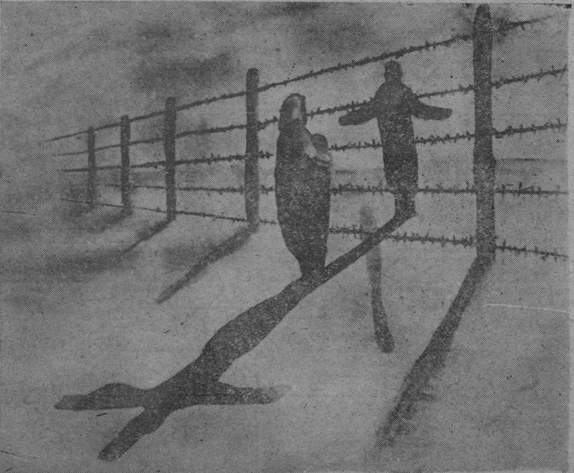
BERLÍN. — "Quería ir de Alemania a Alemania", dice la leyenda de algunos de los carteles editados en la República Federal con motivo del recrudescimiento de la vigilancia junto al muro de la vergüenza, de cuya triste creación se cumple el primer año ahora.

BERLÍN, 13. — La Policía comunista ha lanzado bombas de gas contra berlineses occidentales que se manifestaban contra la existencia del "muro de la vergüenza" los cuales recibieron también chorros de agua. La Policía occidental respondió con bombas de humo. El incidente se produjo en (PASA A SEGUNDA PAGINA)