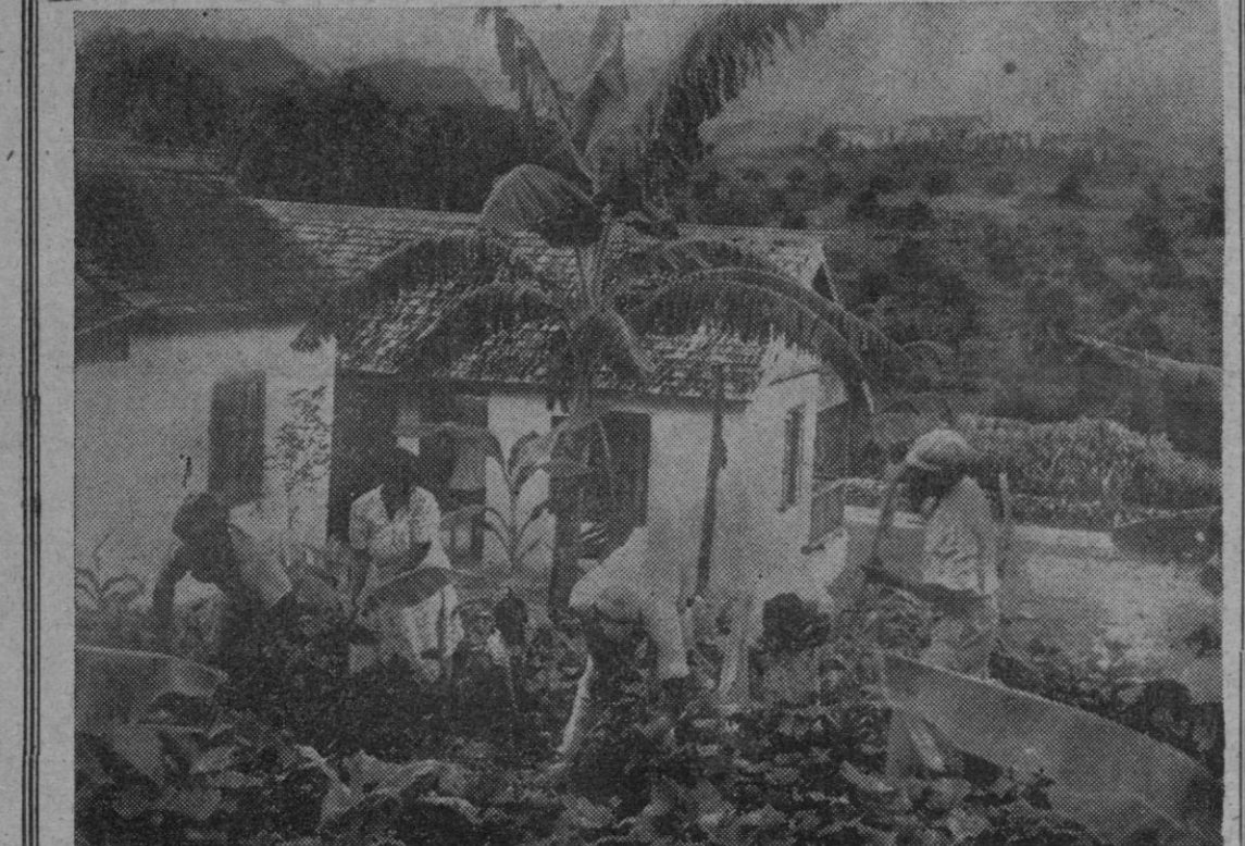
El 6 de agosto, Jamaica, la pequeña colonia de las Indias Occidentales Británicas, asumió la responsabilidad de la independencia. La Constitución con la que Jamaica inicia su independencia ha sido redactada por la legislatura local, y acordada libremente en conversaciones amistosas llevadas a cabo con la Oficina Colonial del Reino Unido. Jamaica continuará voluntaria y simbólicamente bajo la Corona británica. He aquí una granja típica.