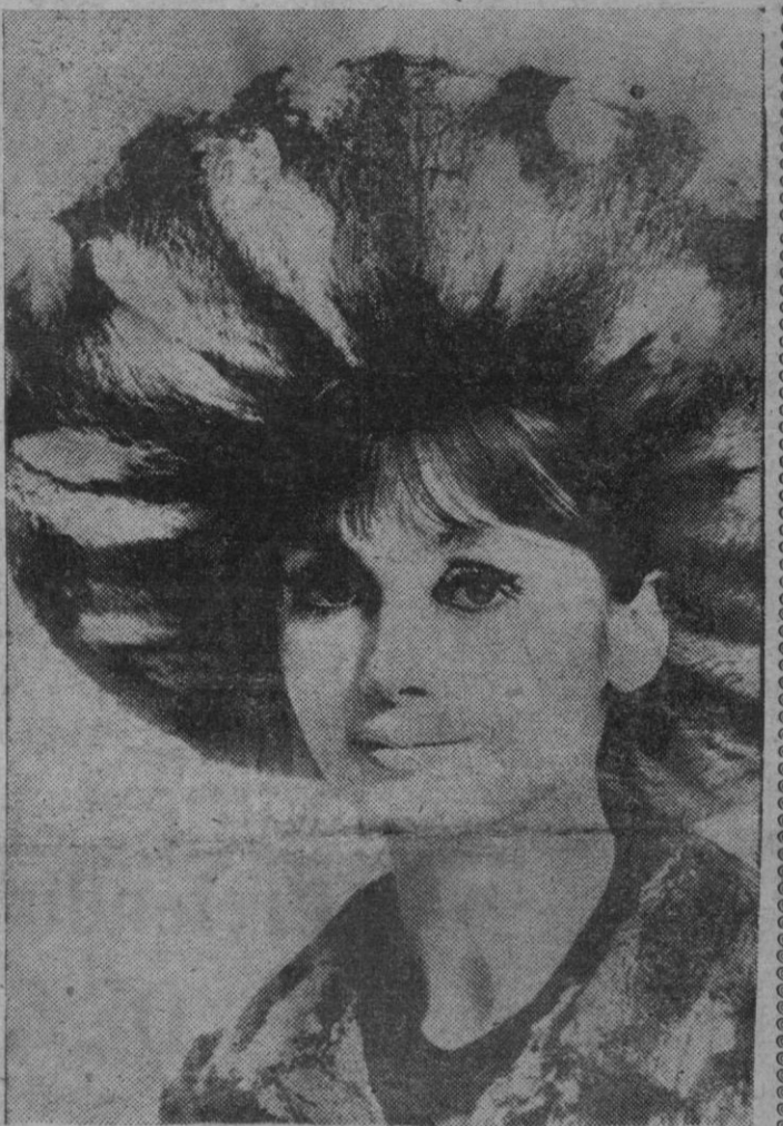
PARIS. — Chombert ha lanzado este aparatoso modelo de sombrero de primavera, realizado en piel de Rumania. — (E. Press).