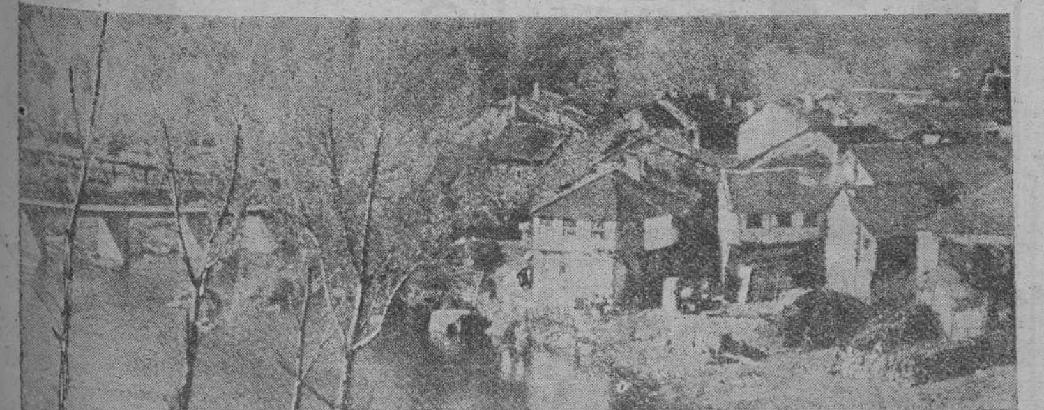
He aquí uno de los lugares del pueblo de Ribadela, imagen retrospectiva, en contraste con los que ya hemos ofrecido a los lectores después de la dolorosa catástrofe

UTRECHT, 17.—La reina Juliana de Holanda resultó herida en un accidente de automóvil, ocurrido cuando la Soberana se dirigía, conduciendo su automóvil, a la estación de Utrecht para recibir a su hija, la princesa Irene, de 19 años. El coche de la Reina chocó contra un coche de patrulla de carreteras de la Policía, resultando así con grandes desperfectos. La reina Juliana continuó su viaje en otro automóvil.