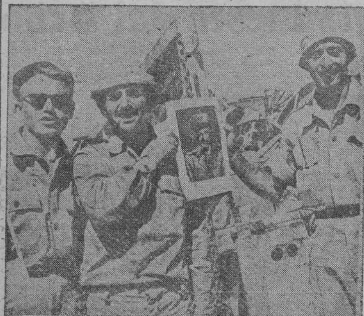
Soldados israelitas muestran uno de los retratos de Nasser hallados al avanzar por la península de Sinaí, durante la guerra de Suez

El equilibrio actual, amenazado por la inmigración de cien mil judíos en Israel