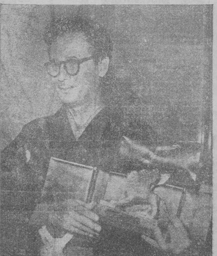
El famoso director cinematográfico japonés, que obtuvo el galardón del "León de Oro", en el último Festival Cinematográfico de Venecia.