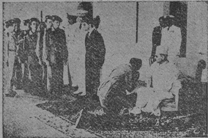
Los cadetes marroquíes de la Zona Norte, rinden homenaje a Mohamad V, antes de salir para las Academias militares