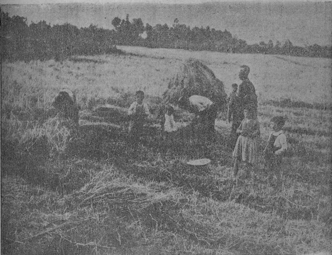
En la parroquia de La Granja, aneja a la de Boqueijón, el pedrisco anticipó desgraciadamente la hora de la siega. La fotografía de Arturo tiene cierto patetismo: el párroco ve con dolor cómo un humilde matrimonio recoge el trigo sin fruto. Asustados todavía por la violencia de la tormenta, las cinco criaturas que aparecen en el escenario de desolación no tenían ánimos para jugar.