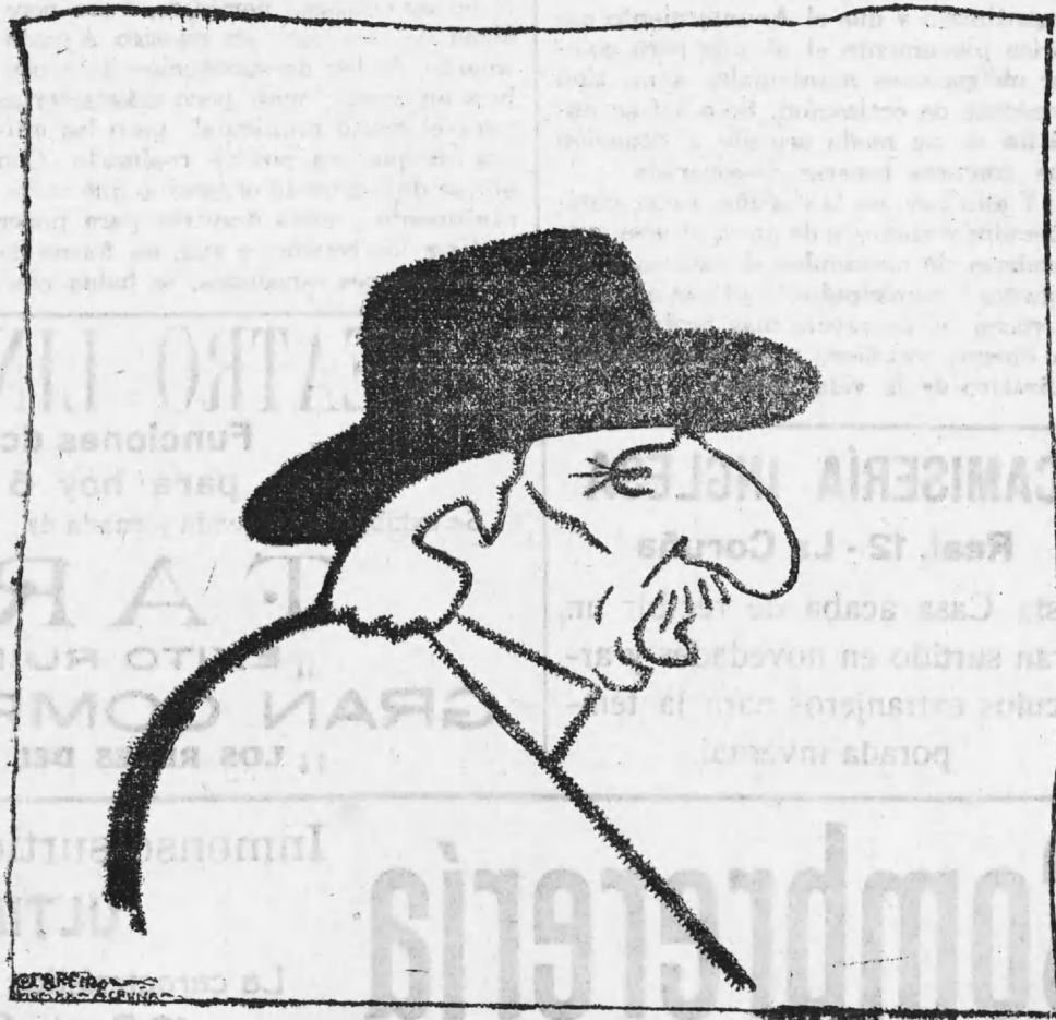
UN MUSICO.... DE CUERDA

Sabemos la cantidad enorme de trabajo, energía y voluntad que dichos señores han puesto en la empresa que ven realizada en su primera parte, y al felicitarlos como coruñeses entusiastas de nuestro pueblo, lo hacemos asimismo de corazón a los señores gerentes y personal de tan importante casa comercial,