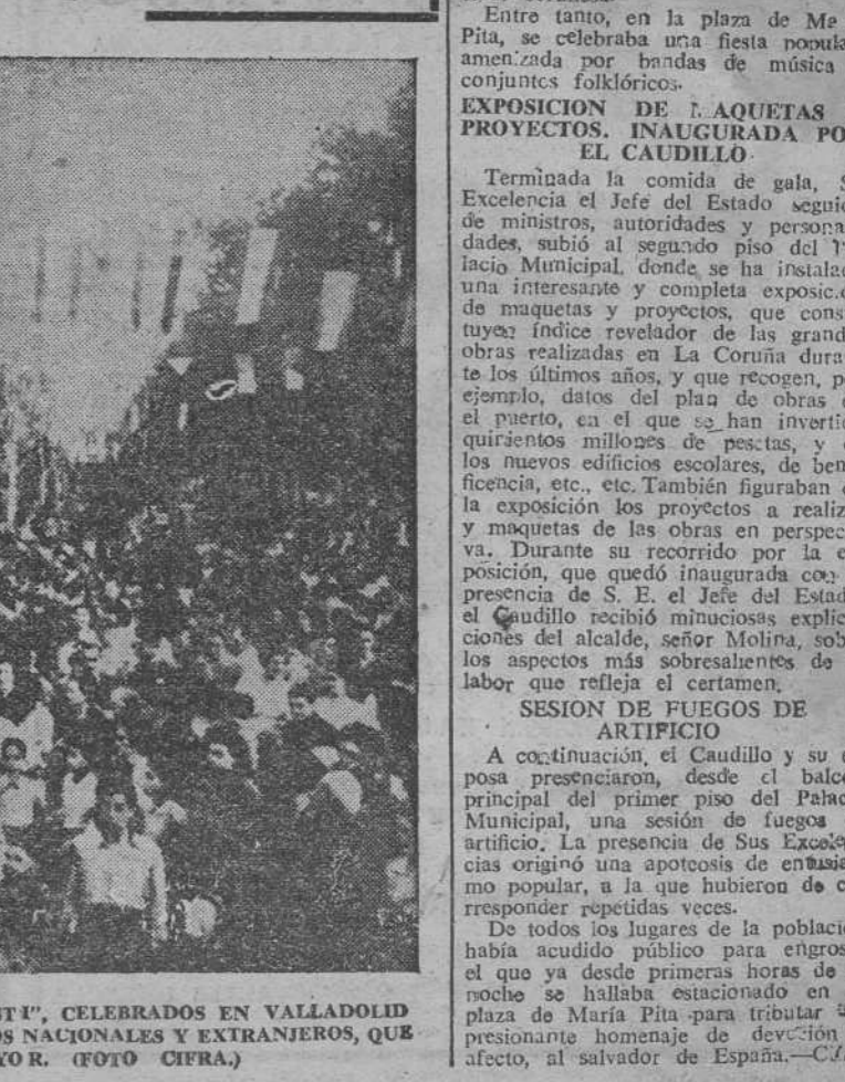
LOS ACTOS DEL IV CONGRESO INTERNACIONAL DE "PAX CHRISTI", CELEBRADOS EN VALLADOLID COMENZARON CON UNA MAGNA CONCENTRACION DE PEREGRINOS NACIONALES Y EXTRANJEROS, QUE AQUÍ APARECEN DIRIGIENDOSE HACIA LA PLAZA MAYOR.