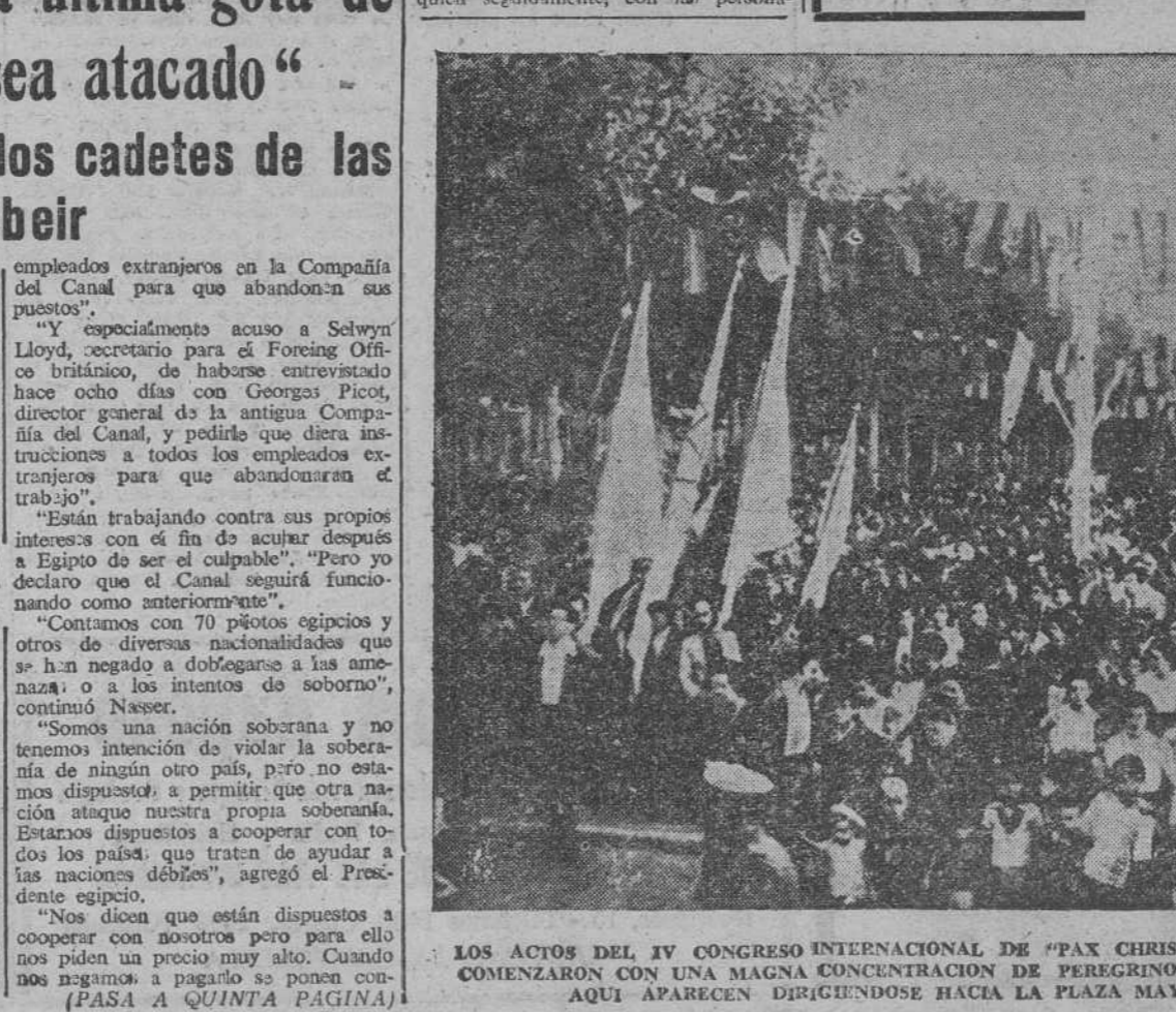
LOS ACTOS DEL IV CONGRESO INTERNACIONAL DE "PAX CHRISTI", CELEBRADOS EN VALLADOLID COMENZARON CON UNA MAGNA CONCENTRACION DE PEREGRINOS NACIONALES Y EXTRANJEROS, QUE AQUÍ APARECEN DIRIGIENDOSE HACIA LA PLAZA MAYOR.