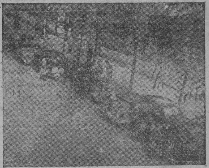
Una de las colas de vehículos, en Madrid, de arbitrario estacionamiento ante los surtidores de gasolina, ya que no existiendo escasez, el pretendido acaparamiento está de más.