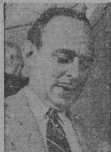
mentos verdadera y vital importancia. En estos momentos en que se acusa —tal vez como nunca— un descenso en las calidades interpretativas de nuestros actores en general.

En efecto, hay que imponer un criterio más riguroso, responsable y amplio en la Escuela Superior de Arte Dramático de la capital de España. La moderna pedagogía debe entrar en este centro para establecer una disciplina y un sentido auténtico de la escena a los jóvenes actores de hoy. Es deprimente ver salir de los Conservatorios a jóvenes más cargados de vanidad y de rutina que de verdadero sentido profesional. Hay que combatir los vicios de declamación, las deformaciones fonéticas y fona imperfección que pueda dar origen al derribamiento de nuestro idioma. Pero la tarea de esta Escuela Superior de Arte Dramático debe ser aun más compleja. Ante todo y no obstante la desaparición del verso en la comedia moderna nuestros actores no deben salir de esta casa sin saberlo decir de verdad. Porque si bien la comedia de verso no se hace hoy, el teatro clásico y el romántico sí se representan —aunque debieran hacerse más— y se da el bochornoso caso de que nuestros jóvenes —y aun maduros actores— salen al escenario con una pobreza expresiva que mueve a lastima.