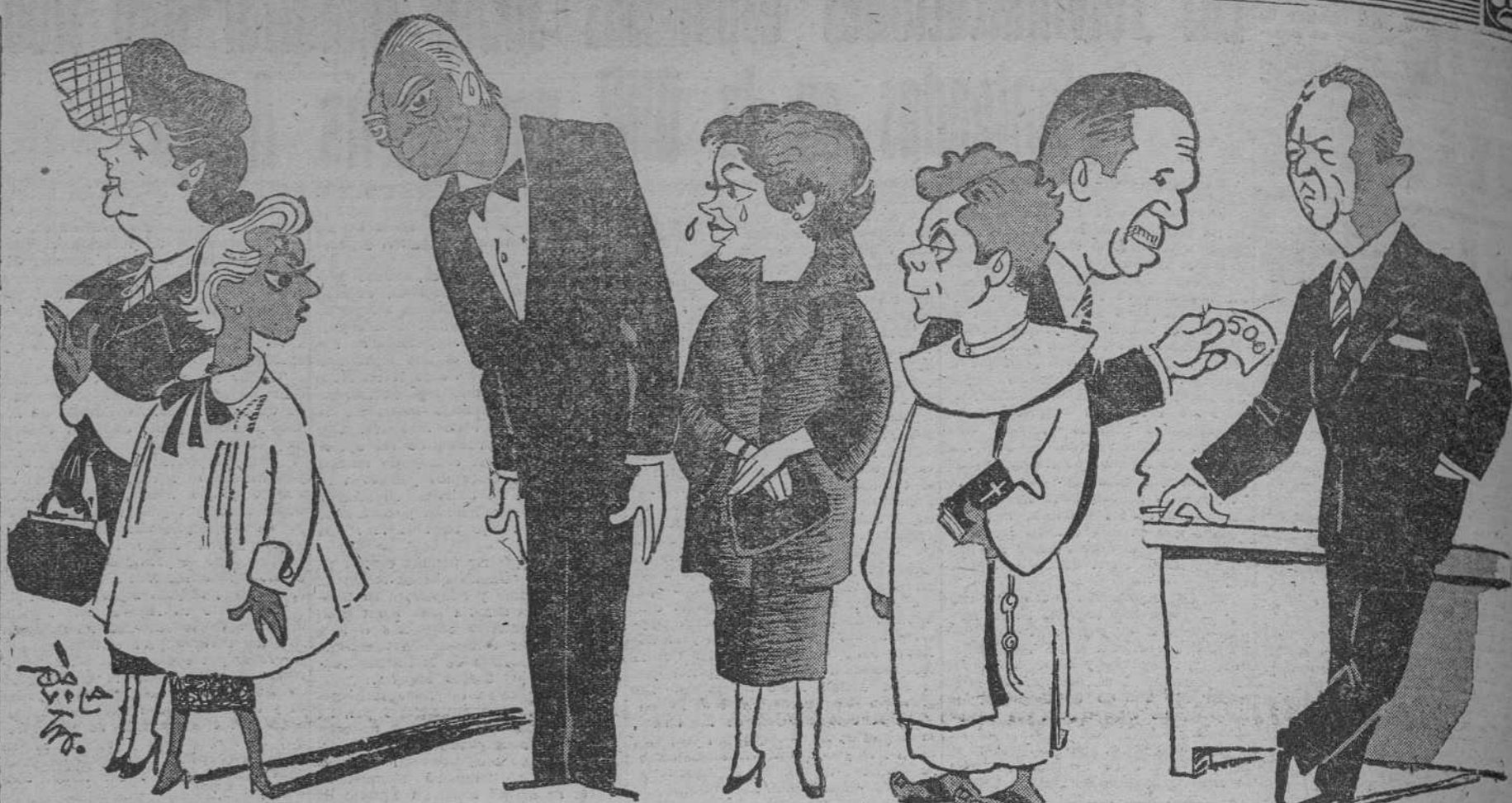
TEATRO LARA. — ESTRENO MUNDIAL DE LA COMEDIA DE PITIGRILLI (VERSION CASTELLANA DE JOSE LOPEZ RUBIO) «LECCIONES DE AMOR»