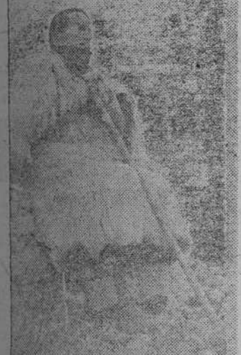
Hasta los pastores han de parecerse a los que desde su litera contempló el emperador. Han vestido ya sus casacas de pieles de borrego o se han envuelto el cuerpo en viejas mantas

PROXIMO REPORTAJE: BURGOS O LA CONTINUIDAD Palenzuela, Torquemada, desolación. «Aquí se casaron de verdad Isabel de Castilla y Fernando de Aragón.»