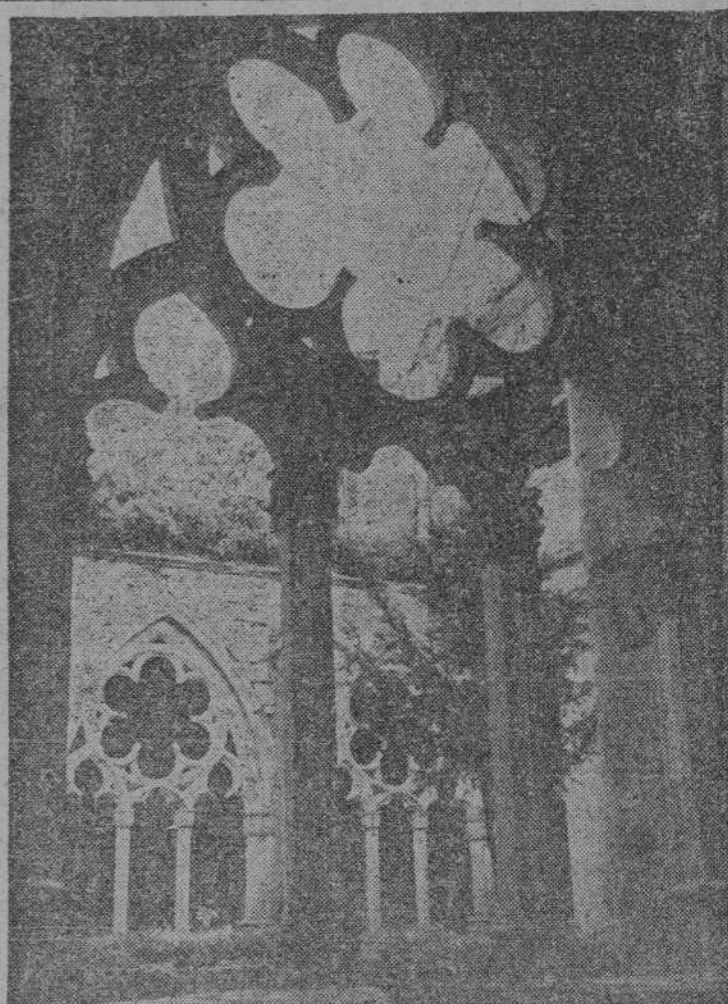
Es un hermoso cementerio de la piedra