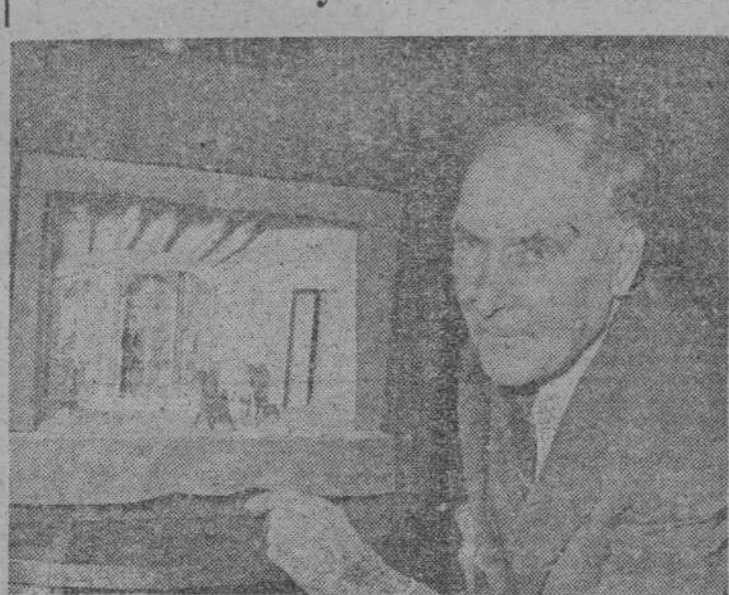
El teatro parisiense de L'Oeuvre ha estrenado una nueva obra de Crommelynck, "Caliente y frío". El mismo autor ha dirigido la realización escénica. La fotografía nos lo muestra durante uno de los ensayos, contemplando una maqueta del decorado