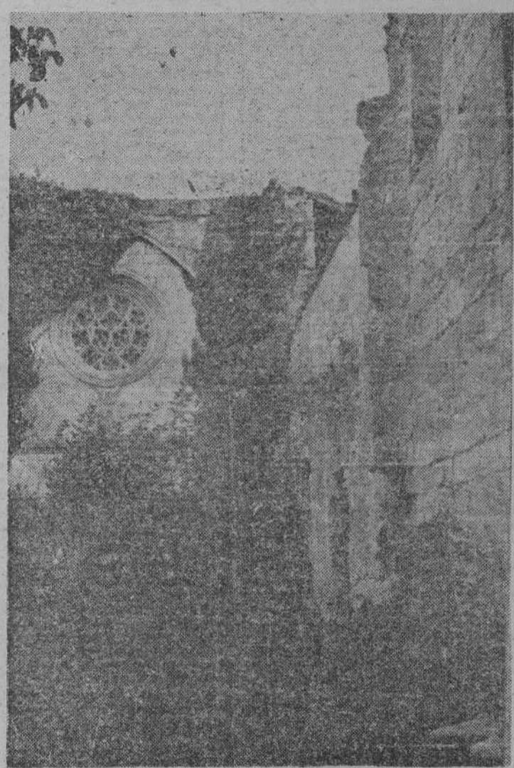
La iglesia de Fresdelval, que debió ser bellísima, es un rectángulo de piedra limitado por cuatro muros

apetencias de la población campesina y las posibilidades de realizarlas. El trigo resultará caro a cuatro pesetas el kilo para el inquilino del barrio de Salamanca o de Tetuán de las Victorias, pero para el labrador, que sacrifica un año de vida por cada tonelada que obtiene, es regalado. No entran aquí en juego los factores económicos. Lo que importa es que ahí al lado, en Bilbao (hasta ahora el único Eldorado absorbente, aunque más abajo irán vendiendo nombrados otros), se duerme bajo un techo caliente y los domingos pueden dedicarse al «chiquiteo» o a pasear, y no hay amenazas de heladas o calores intempestivos que echen a rodar la labor y las esperanzas de meses y meses.