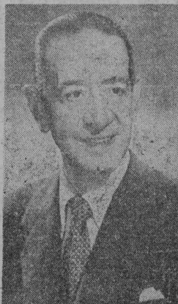
Risas: "Tornadas", "La flor de los Pazos"; de Fernández Ardavín: "El deseo", "La cantora del puerto"; de Federico Oliver, a la vez que autor, uno de los mejores directores que he conocido: "Los semidioses", "El pueblo dormido" y "El crimen de todos". Ya comprenderá que omito muchas obras y no pocos autores, no puedo recordarlo todo ahora. ¡Ah!, y también estrené, en el teatro Benavente, la primera obra de Penam, "El divino impaciente", que fue un éxito clamoroso, y le dimos más de 500 representaciones.

Y tras una pausa, en la que sin duda se esfuerza en separar, de entre tantas obras, los títulos más significativos, prosigue: —De don Jacinto Benavente, aparte de lo ya citado, he estrenado, entre otras: "La mariposa que voló sobre el mar", "No quiero, no quiero", "La noche iluminada" y "De muy buena familia"; "Cabría que tira al monte"; "Cristianas"; "Barro pecador"; "Pasionera", de los hermanos Álvarez Quintero. También recuer-