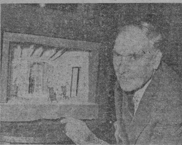
El teatro parisiense de L'Oeuvre ha estrenado una nueva obra de Crommelynck, «Caliente y frío». El mismo autor ha dirigido la realización escénica. La fotografía nos lo muestra durante uno de los ensayos, contemplando una maqueta del decorado