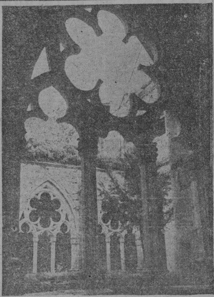
Es un hermoso cementerio de la piedra