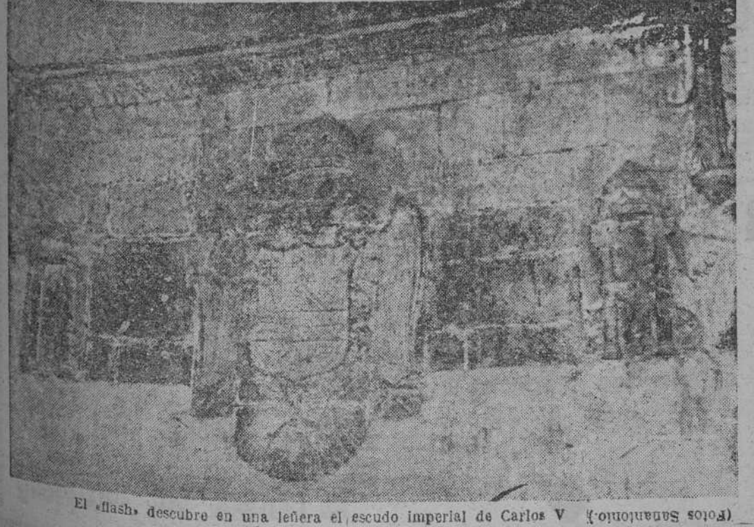
El «flash» descubre en una leñera el escudo imperial de Carlos V

Lunes, 23 (seis y media de la tarde). Don Recaredo me preguntó el tema de hoy: Spinoza. Hablé durante media hora, y después de felicitarme me puso la máxima puntuación: un 10. Creo que este año aprobaré, por fin, la Historia de la Filosofía. Y a lo mejor con matrícula de honor y todo. Desdiciéndamente, Mani es un chico encantador. Saldré con él todas las tardes.