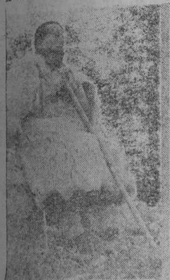
Hasta los pastores han de parecerse a los que desde su litera contempló el emperador. Han vestido ya sus casacas de pieles de borrego o se han envuelto el cuerpo en viejas mantas

HEMOS ido dando saltos a través de las estaciones del año y en ningún momento con las previsiones del calendario. Es la temperatura y el paisaje quienes nos lanzaron el primer golpe desde el verano al otoño, y ahora desde el otoño al invierno. Nos adentramos en la provincia de Burgos, con tiempo frío y viento. El cielo plomizo forma una ingente capota sujeta a las cimas de la montaña. Tierra de sierra, con matas de montaña y peñascos buenos para el bandidaje y la guerra de guerrillas. Queda a nuestra derecha el pico de San Cristóbal. Cruzamos el Ebro, todavía poco importante, y después de una larga ascensión la carretera nos deja situados en la meseta. Corre un viento helado sobre la monotonía de las lomas que ondulan suavemente. Puede descansar la vista. Incluso cabe echar un breve