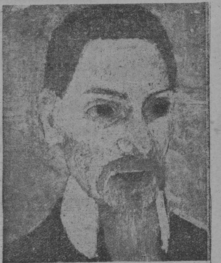
Rilke, óleo de Paula Nodersohn Becker, cuya muerte inspiró el «Réquiem a una amiga»

El poeta vivía intoxicado de su propia poesía inefable y contagiado con su