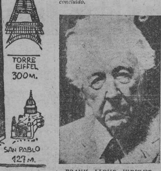
EL "ILLINOIS" SAN PABLO 1732 M. 127 M.

Los problemas arquitectónicos que la construcción de semejante edificio plantea serán enormes, pero Frank Lloyd Wright piensa solventarlos, por lo menos teóricamente, puesto que dada la duración lógica que deberá tener las obras no es probable que el arquitecto llegue a ver su edificio concluido.