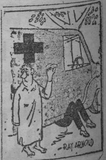
sin palabras (De «El Bazar»)

Rilke murió, pues, de su propia muerte el 29 de diciembre de 1926. Unos días antes, cuando fue a cortar