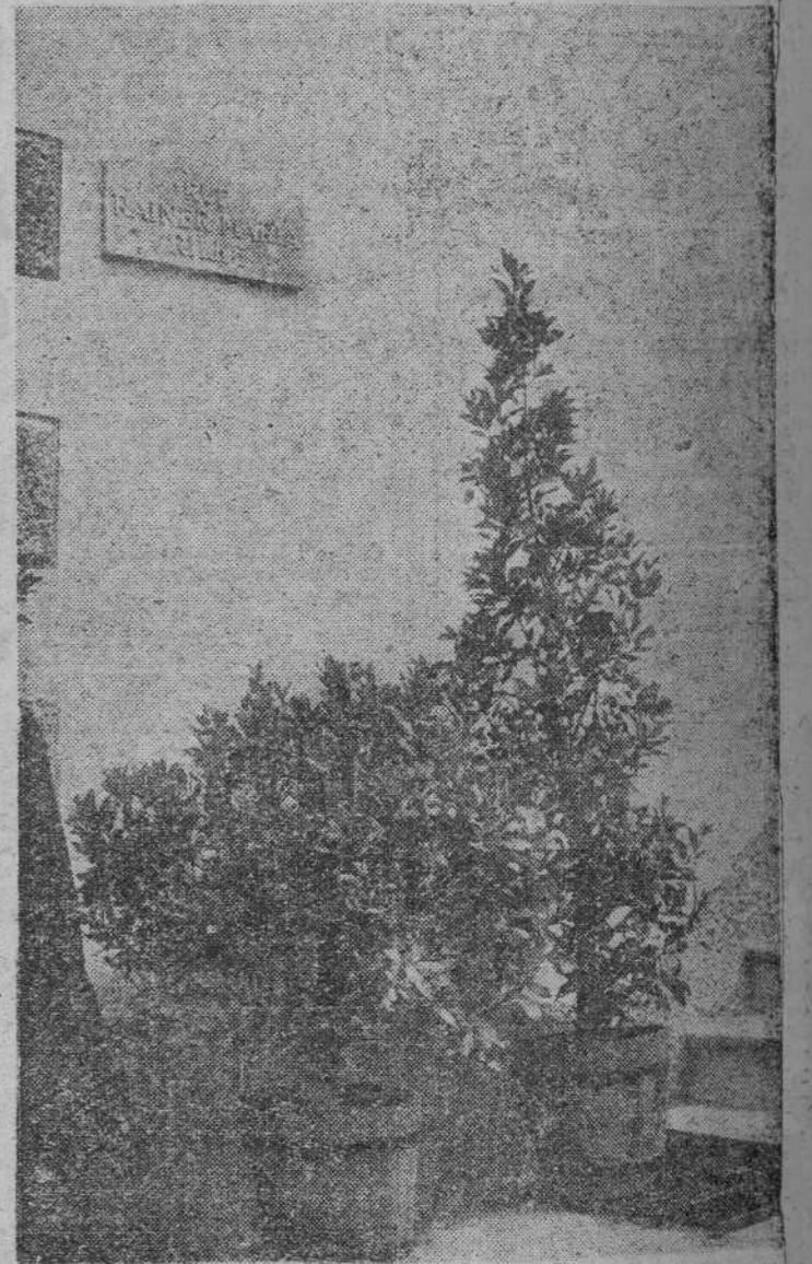
En Vallis, donde transcurrieron los últimos años de la vida del famoso poeta Rainer Maria Rilke, se descubre una lápida que da el nombre del poeta a una de las calles de la ciudad

Estalla la guerra europea. Rilke se encuentra rodeado de fervorosos y feroces, de mecenas que riñen entre sí por apoyar en sus casas, por ofrecerle sus mejores, faisanes, por sentarle en sus más cómodas butacas. Mecenas conocidos y mecenas anónimos. Una o una de ellas le legó en testamento 20.000 coronas; otro u otra le envió un cheque con otra escandalosa suma. Rilke los desprecia a todos. Se siente señor de la poesía, intocable, divinidad con americana y lira. Encuentra el culto más fabuloso del mundo. Kippenberg, que le regala dinero sin pedir nada a cuenta. Pero la guerra ha es-