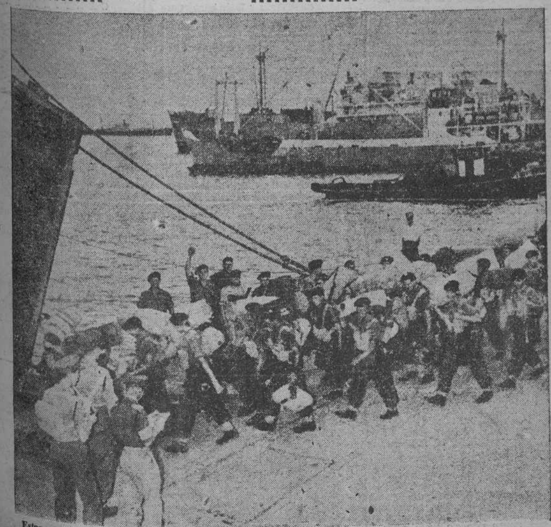
Estos soldados ingleses que han luchado en Suez son los primeros en retornar a su país. Punto de embarque: Fort Said, a bordo del transatlántico "Evan Gibb". Destino: sus hogares, donde, al fin, podrán pasar las Navidades sin temor a las balas enemigas.