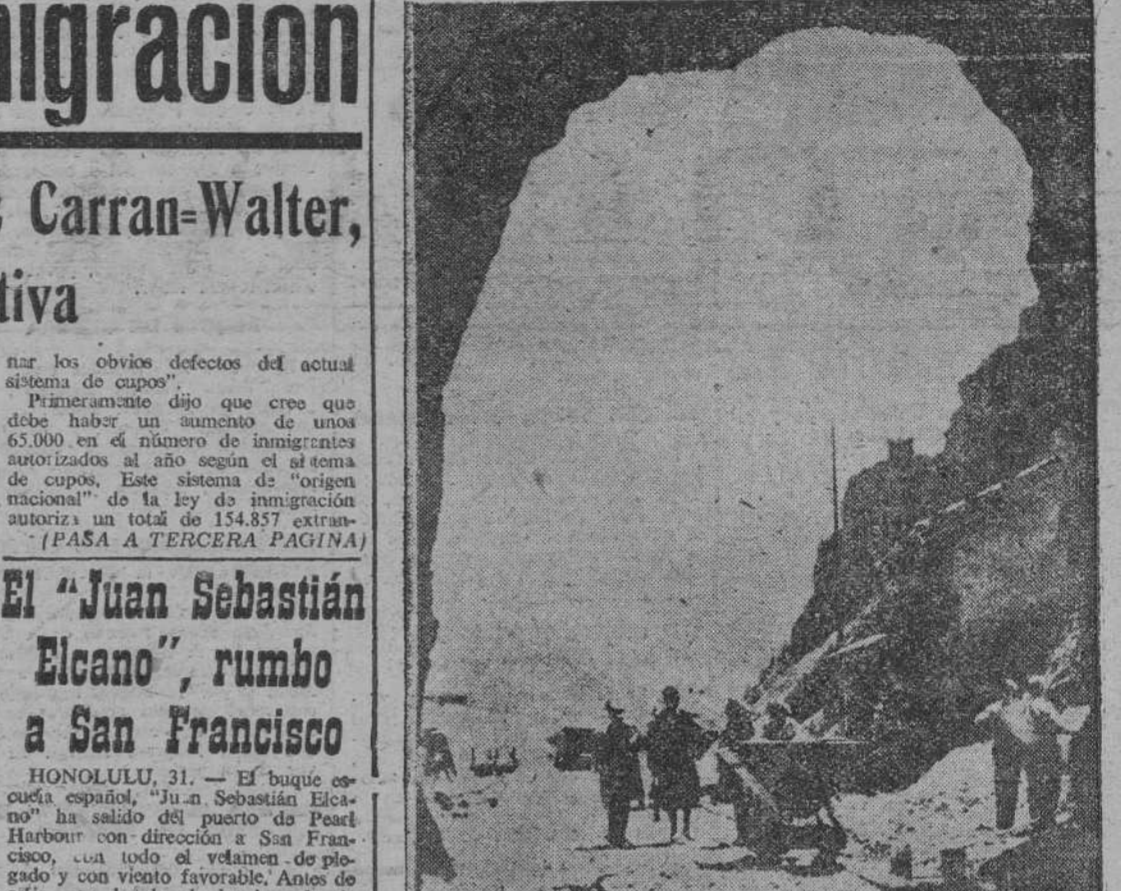
Aprobado el proyecto de un túnel bajo el Mont Blanc, que será el más largo del mundo, pues ha de medir 18 kilómetros, se realizan las obras, mostrándose un aspecto de las mismas desde la entrada por la vertiente italiana. El túnel se habrá terminado dentro de tres años.

En el sorteo celebrado ayer, resultó premiado el número 775.