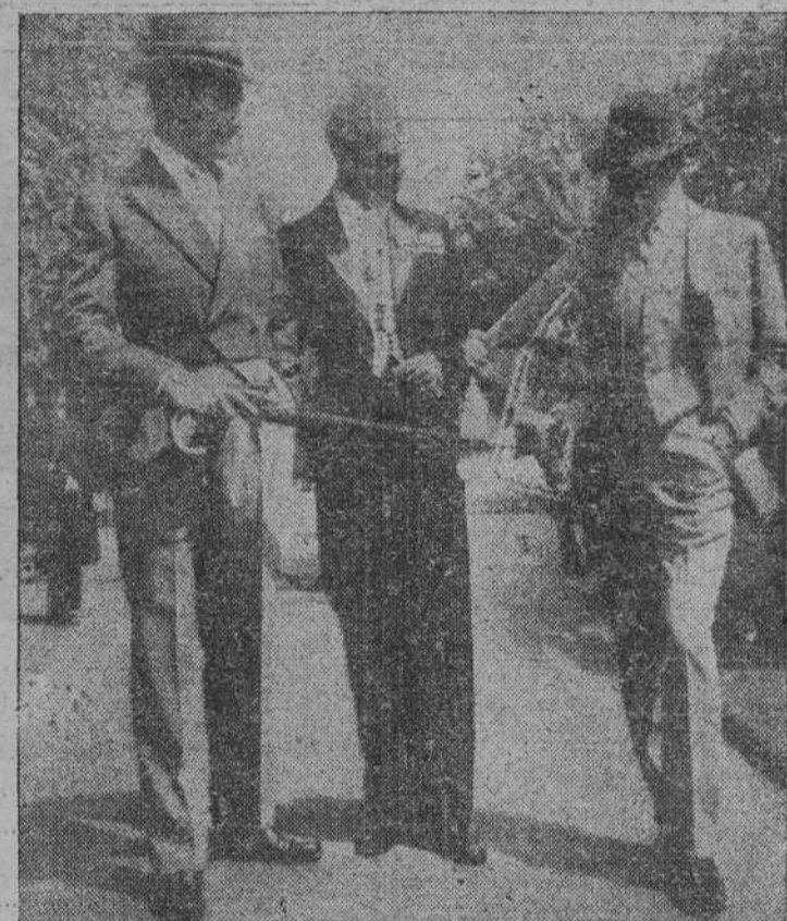
Si bien la moda masculina suele cambiar poco, la del año actual se anuncia con algunas fantasías. Estos tres modelos presentan en Londres un traje de carreras, otro de gala en azul oscuro y, el de la derecha, traje de calle cuya novedad reside en ir forrado con motivos de casa.