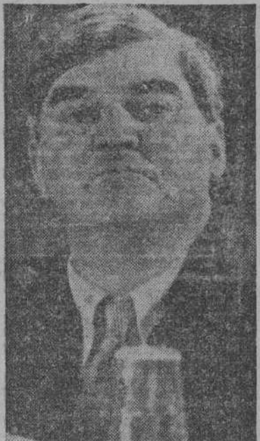
Bevan, el «merlín» del laborismo británico

Parece claro, a juzgar por el panorama actual, que si los conservadores pierden las elecciones de 1960, no será Bevan el que Mac Millan, sino porque los socialistas ofrecen un programa mejor a la opinión pública. Hasta ahora no hay indicios de que tal programa exista y es que dentro del partido se va a luchar a brazo partido. Esto hace prever una aspera batalla entre Gaitskell, jefe del partido, y Bevan, su figura más sobresaliente, para este verano, durante los preparativos de la conferencia nacional de Brighton.