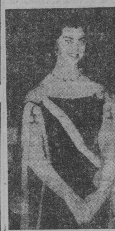
Margarita de Suecia, en traje de Corte

BARAJAS, 10. — En avión de Iberia, procedente de Málaga, regresó la princesa Margarita de Suecia, que ha pasado una temporada de descanso en Torremolinos, era portadora de siete artísticos ramos de claveles de varios colores, obsequio de sus amistades de Málaga y Torremolinos, y que iban adornados con cintas de los colores de Suecia y de España.