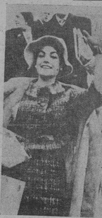
La actriz española Carmen Sevilla desciende, en el aeropuerto de Barajas, del avión que la ha traído a España, después de una gira artística por varios países sudamericanos.