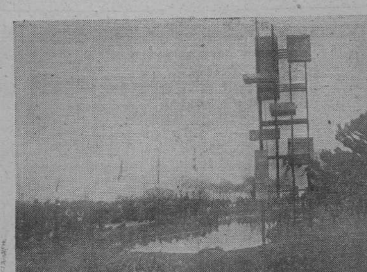
En Barcelona se ha celebrado una jornada de urbanismo, que ha presidido el Ministro de Obras Públicas. Con motivo de las reuniones fue inaugurado este monumento al ilustre urbanista Cerdá, asistiendo a ella los ministros Vigón y Gual Villalbi.