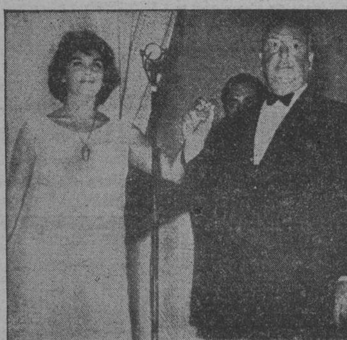
Ana Mariscal presenta al director norteamericano, Alfred Hitchcock, antes de la exhibición de un filme

No basta que un actor "viva" su papel. También es preciso que el productor conozca el temperamento del intérprete