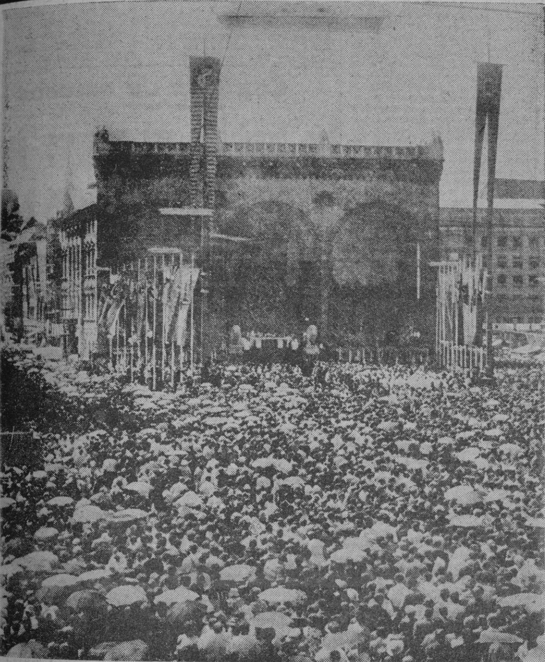
Con un Pontifical, oficiado por el Cardenal Arzobispo de Munich, José Wendel, en la plaza de Theatiner, se abrieron las jornadas eucarísticas del Congreso de Munich. Al sagrado oficio asistieron miles de personas, el Gobierno en pleno de Baviera y varios Príncipes de la Iglesia.