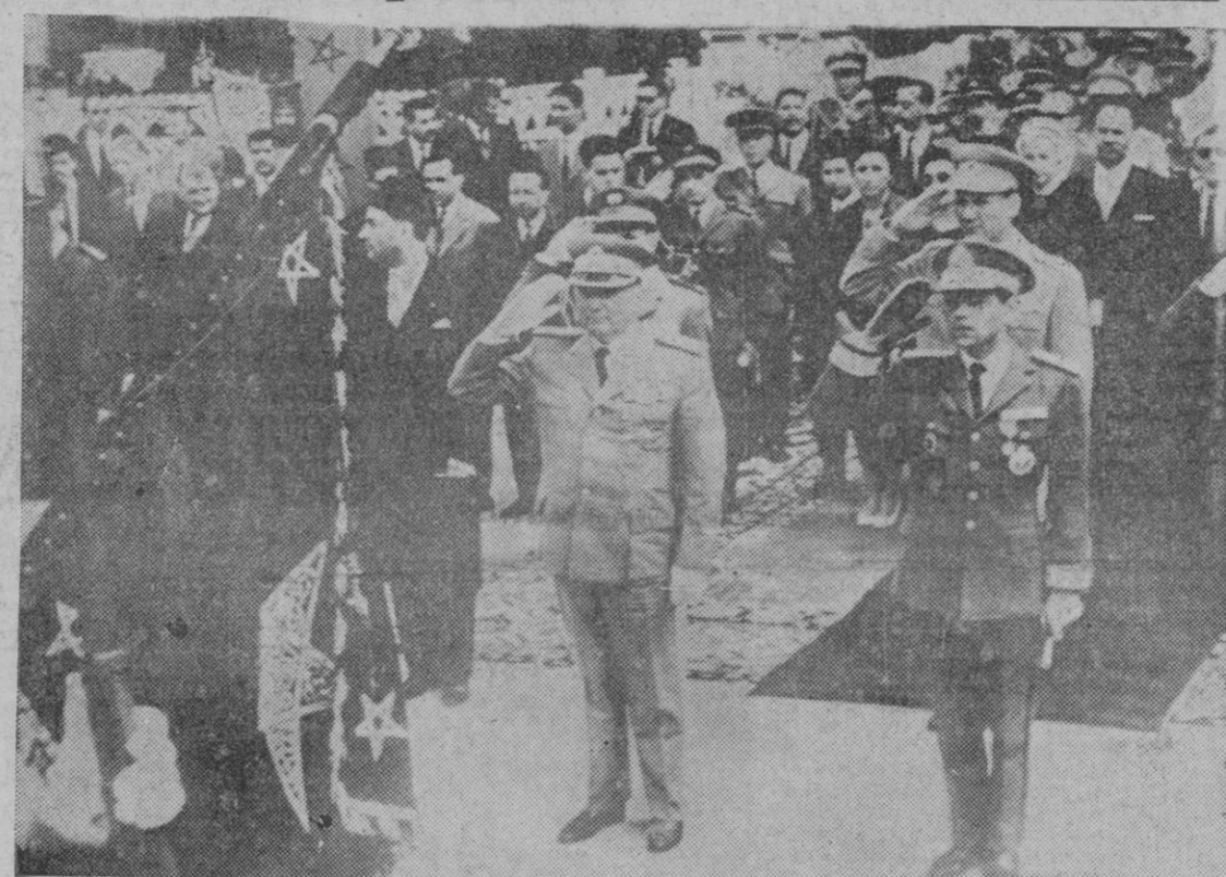
CASABLANCA.—Invitado expresamente por el Rey Hassan II, el mariscal Tito, de Yugoslavia, llegó a Marruecos a bordo de su yate personal, el "Galeb", acompañado de su esposa. En la fotografía, a su llegada a Casablanca, Tito saluda a la bandera marroquí. A su izquierda Hassan II