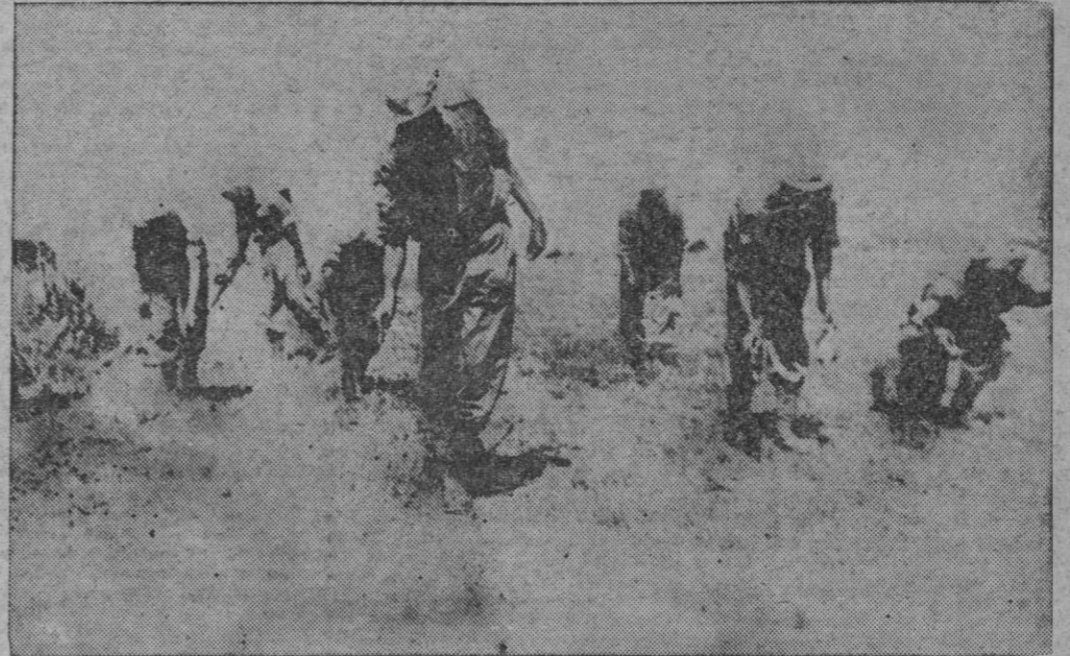
KONGOLO. — Unas patrullas de Ingenieros Indios de las fuerzas de las Naciones Unidas proceden en las pistas del campo de aviación a la localización y limpieza de las minas colocadas por los soldados de Katanga antes de su retirada ante el avance de los "casco azul".