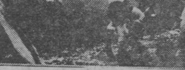
Un acoso ante la portería del Fabril

FERROL: — Giráldez; Granda, Villar, Dávila; Miguel, José; Julio, Nanuco, Arturo, Posada y Suco II.