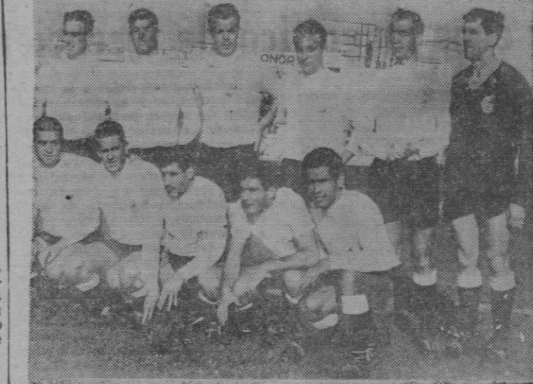
Equipo del Constancia de Inca

OTRO BUEN PARTIDO DEL PONTEVEDRA Otra vez hemos visto lo que pueden el entusiasmo, la moral, se coraje extraordinario de los hombres que visten la camiseta granate, aunque sea, con las sustituciones que pudieron hacer pensar en el riesgo y que no han hecho sino, en cualquiera de sus casos, cumplir con los mejores. Es muy posible que les haya perjudicado su intento en ocasiones, de pretender hacer juego de clase; pero lo que no puede discutirse a ninguno, es su total entrega en el campo, contra un rival de esa categoría y por encima del barro y de otros imponderables. Desde Gato, hasta Ferrelirio, una vez más, pasando por la defensa, media y demás de-