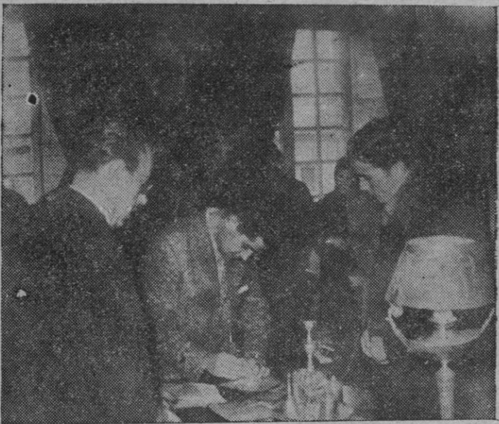
El Alcalde de la ciudad, haciendo entrega de los sobres a los componentes de la "Orquesta Compostela"