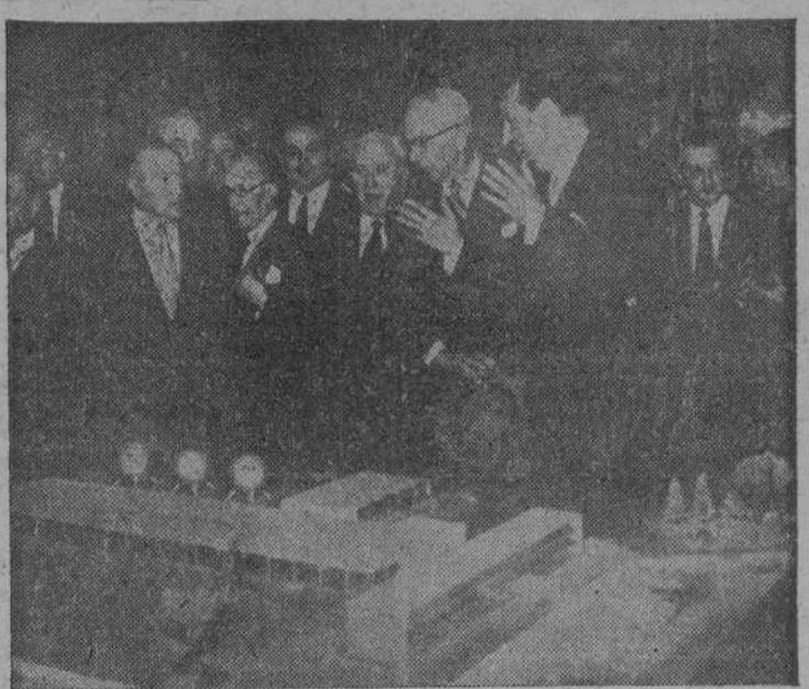
En el recinto de la Feria del Campo, de Madrid, quedó inaugurada la Exposición "El átomo y sus aplicaciones pacíficas", que ha sido organizada por el Sindicato Nacional del Agua, Gas y Electricidad, con la colaboración de la Junta Española de Energía Nuclear. Al acto asistieron los ministros de la Gobernación, Industria y Secretario General del Movimiento