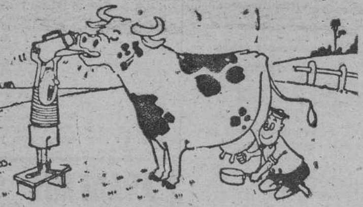
—Bueno, ahora ordeña, a ver si sale café con leche.

8: Río español. Tempestad de truenos. SOLUCION AL ANTERIOR HORIZONTALES.—1: Malnotazo.—2: Arenal.—3: Ra. asora.—4: Ada. of.A.—5: Meleina.—6: Ozú. Ron.—7: Cananda.—8: Sil. naM.—9: Soles. Se.—10: Elevas.—11: Repetira. VERTICALES.—1: Moramos. Ser.—2: adeZ. Sole.—3: Na. alucife.—4: Ora. Eleve. 5: Tesón. saT.—6: Anotarán. SI.—7: Zera. Odas.—8: Oia. anamela.