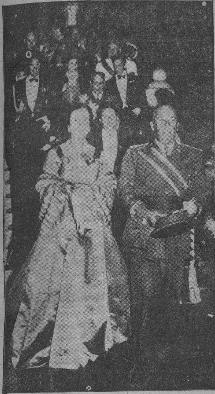
Su Excelencia el Jefe del Estado, acompañado de su esposa, doña Carmen Polo de Franco, desciende por las escaleras del Palacio Provincial de San Sebastián una vez terminada la cena de gala que les fue ofrecida por la Diputación Provincial de Guipuzcoa