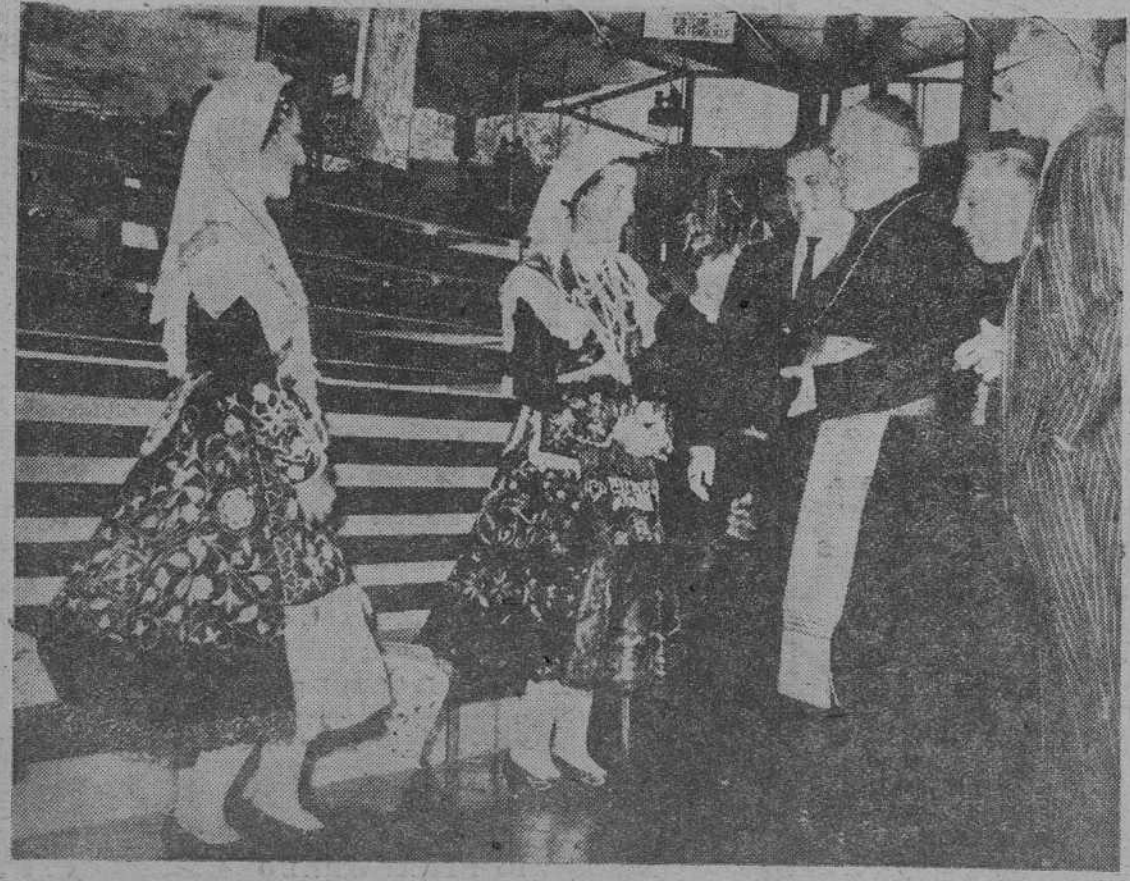
ESPAÑOLES EN BRUSELAS. — Durante su recorrido por el Pabellón de España en la Exposición Internacional de Bruselas, el cardenal Arriba y Castro, arzobispo de Tarragona, acompañado del embajador español, conde de Casa Miranda, se detiene a conversar con estas muchachas españolas que, ataviadas a la típica y barroca usanza charra, ponen una alegre ventana pintoresca por la que pueden asomarse a nuestra Patria los visitantes de la "Expo"

Durante su recorrido por el Pabellón de España en la Exposición Internacional de Bruselas, el cardenal Arriba y Castro, arzobispo de Tarragona, acompañado del embajador español, conde de Casa Miranda, se detiene a conversar con estas muchachas españolas que, ataviadas a la típica y barroca usanza charra, ponen una alegre ventana pintoresca por la que pueden asomarse a nuestra Patria los visitantes de la "Expo"