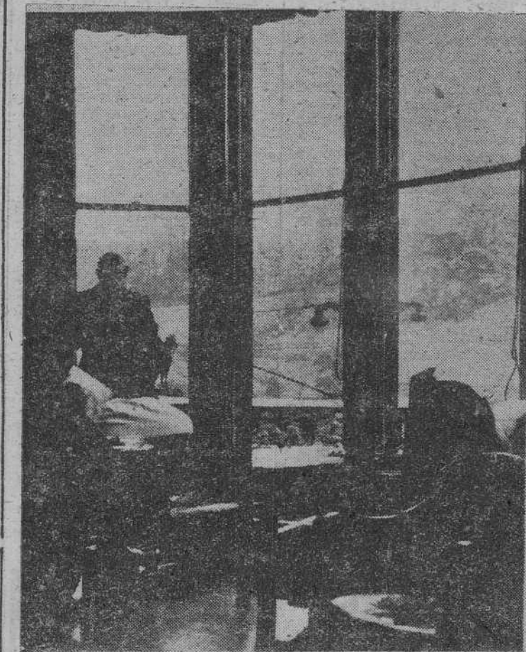
La tranquilidad, sosiego y quietud de los Clubs británicos es proverbial. He aquí la sala de lecturas de uno de ellos, reposando de paz física y nudo de relaciones sociales.

Aunque en muchos aspectos los Clubs no son hoy lo que eran en el pasado siglo, su número y variedad continúan siendo un exponente de la afición que el inglés siente por el Club. Por lo que a Londres se refiere, basta darse un paseo desde la casa de Wellington en la esquina de Hyde Park, a lo largo de Piccadilly, bajando por Saint James's y terminando en Pall Mall, para apreciar su diversidad de épocas, de estilo y de contenido.