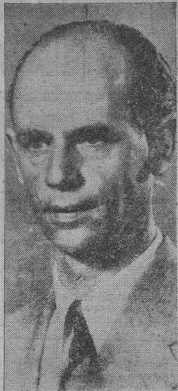
El Dr. Ernst Stuhlinger, Director de la oficina de proyectos de investigación del Departamento de Projectiles, Balística, del Ejército de los EE. UU. trabaja desde hace 5 años en el estudio y desarrollo de sistemas de propulsión eléctrica para las naves del espacio.

piral a una altura de sesocientos millas sobre la superficie de Marte. La tripulación para los motores y se prepara para la exploración del planeta. El momento oportuno para iniciar el viaje de vuelta se producirá cuatrocientos setenta y dos días más tarde. Este largo período de espera dará tiempo suficiente a la tripulación para observar a Marte con detenimiento por telescopio y con cohetes-sonda; a descender a su superficie árida con un vehículo alado de aterrizaje, a explorar el terreno y estudiar sus misterios y finalmente a regresar a la nave con la ayuda del mencionado vehículo de aterrizaje. El viaje de regreso a la Tierra será similar al viaje de ida. A pesar de que se dispone de técnicas relativamente sencillas con la que impulsar, dirigir y navegar una nave de espacio, quedan una porción de cuestiones que pueden parecer mucho más difíciles de resolver. Los meteoros y los rayos cósmicos suponen un peligro desconocido para los seres humanos que vienen protegidos por la atmósfera de la Tierra. Para que un gran problema mantener una atmósfera artificial para que los seres humanos puedan vivir dentro de su alojamiento y proyectar trajes especiales con que los hombres puedan trabajar con comodidad. El plazo de dos años durante el que la tripulación habrá de vivir monotonamente dentro de la nave, puede traer una insoportable psicología. Pero las perspectivas no son tan negras como parecen. Pueden pro-