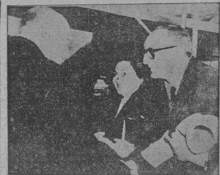
El presidente Eisenhower saluda al Presidente argentino, Arturo Fronzizi y su esposa, a su llegada a Washington en visita oficial

En un almuerzo en el Club Nacional de Prensa, dijo Fronzizi: "Estoy firmemente convencido de que la Prensa está en disposición de desempeñar una labor que no dudo en calificar histórica, siempre y cuando esté dispuesta a asumir sin reservas su responsabilidad real".—Efe.