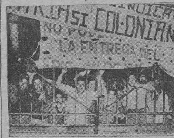
Dos documentos gráficos del paro total en Argentina. A la izquierda, obreros del frigorífico municipal "Lisandro de la Torre", de Buenos Aires, reciben con pancartas y gritos a las fuerzas del Ejército que acuden a desalojarlos. A la derecha, un tanque militar irrumpe en el local

El Gobierno mantiene las medidas de precaución Graves disensiones entre los promotores de la "huelga insurreccional"