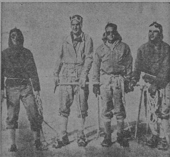
Cuatro montañeros, que ya el pasado año escalaron el Mont Blanc, se disponen ahora a escalar el Kenya, el Mawenzi y el Kilimanjaro. Son cuatro segovianos de la Guardia de Franco