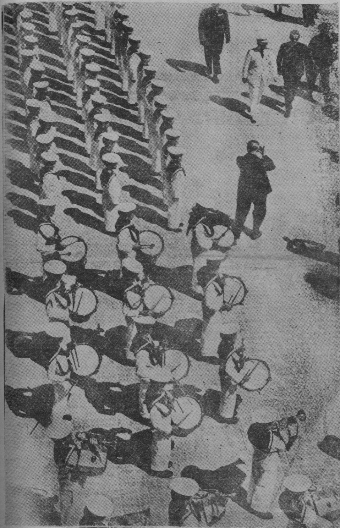
Las jornadas del Caudillo en Valencia estuvieron impregnadas de su infatigable actividad. En la fotografía, Franco pasa revista a los Flechas Navales.

Presenció una exhibición aérea en la base de Manises En el pueblo de Aldaya fué aclamado por el vecindario de toda la comarca