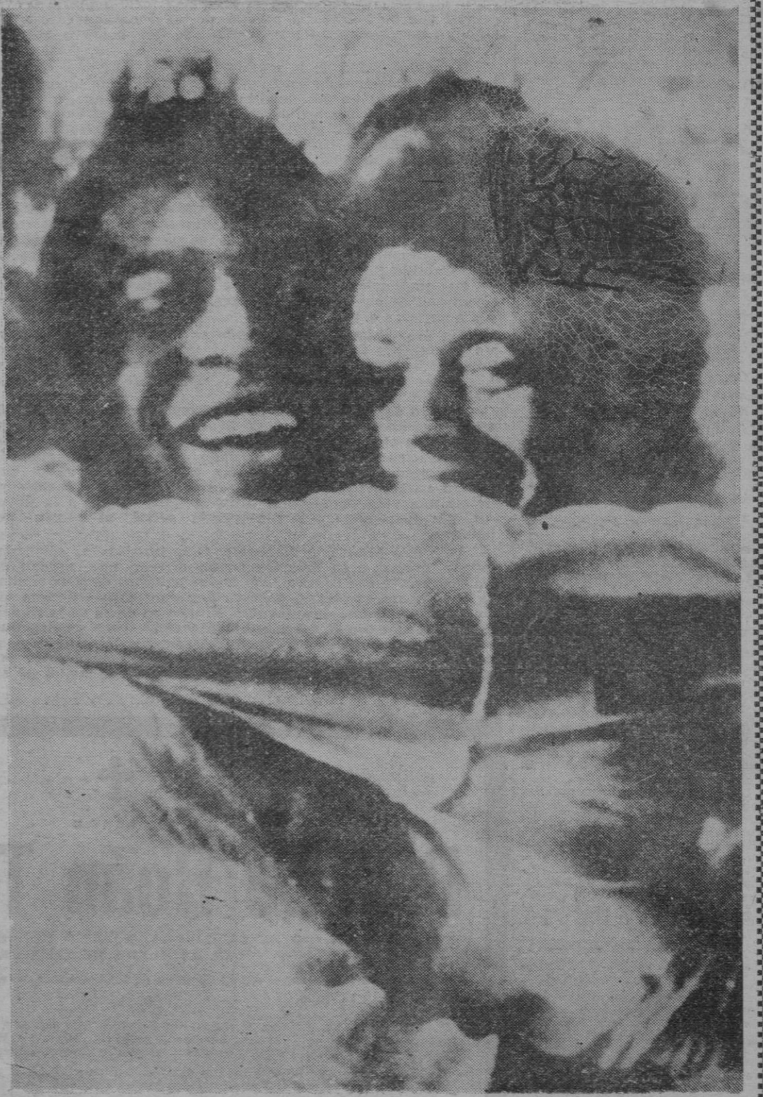
Brasil venció a Checoslovaquia por tres goles a uno y se proclamó campeón del mundo por segunda vez. Pelé abraza jubilosamente a su compañero y sustituto, Amarildo, momentos después de concluir el encuentro de la victoria.