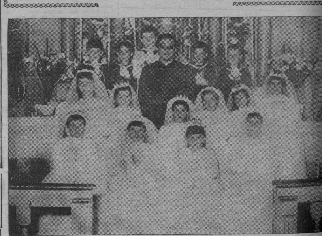
Grupo de niñas que el pasado domingo recibieron la Primera Comunión en la Iglesia parroquial de Figueiras.