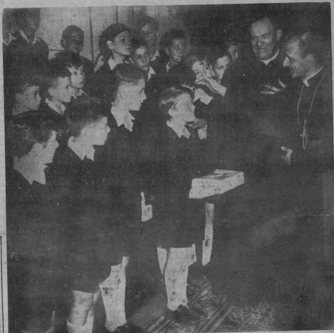
Un grupo de pequeños cantores de París actuando, en la Scala de Milán en el año 1960, siendo recibidos a continuación, por el entonces Cardenal Montini, hoy Papa Paulo VI. Anteriormente llegó a Compostela otro grupo de Pequeños Cantores que actuarán en nuestra ciudad en los próximos días.