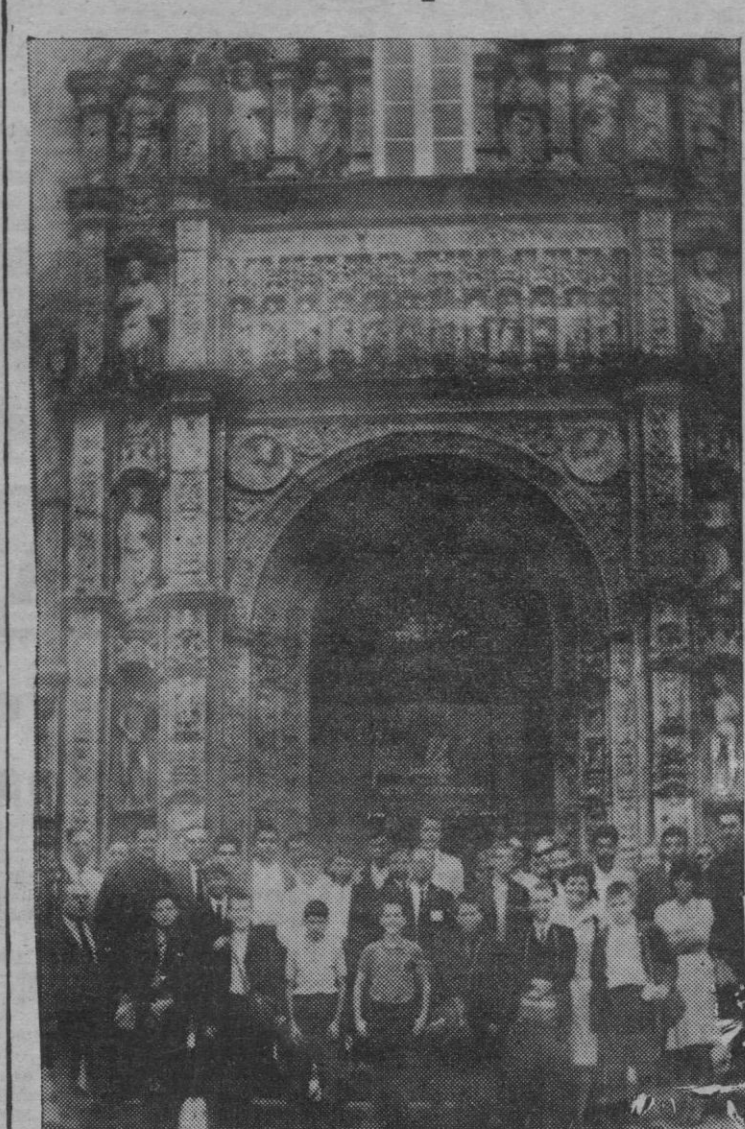
Grupo de niños cantores que se encuentra en Santiago