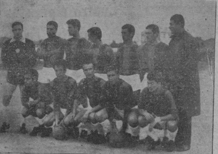
Club Chaves, de Portugal.

el árbitro, colegiado coruñés señor Feal y linieros de Santiago Sres. Lino y Balsa.