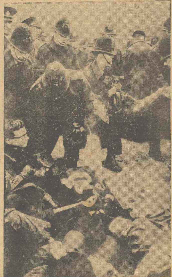
RUSSLIP (Inglaterra). — Cuando una manifestación de protesta marchaba contra la base americana instalada en Russlip, Middlesex, los componentes de la misma se encontraron con 2.500 policías que la esperaban en las afueras de la base. La manifestación estaba compuesta por unos 650 elementos. En la foto, los policías deshaciendo la manifestación. Se ve cómo dos de ellos se llevan a una chica. — (Foto Europa Press)