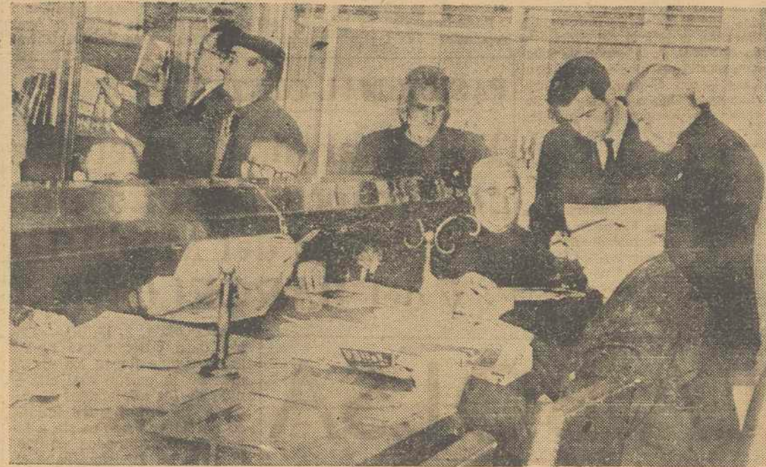
La biblioteca del Hogar del Jubilado de Segovia.

La iniciativa surgió de la Caja de Ahorros, que tiene a cargo su funcionamiento