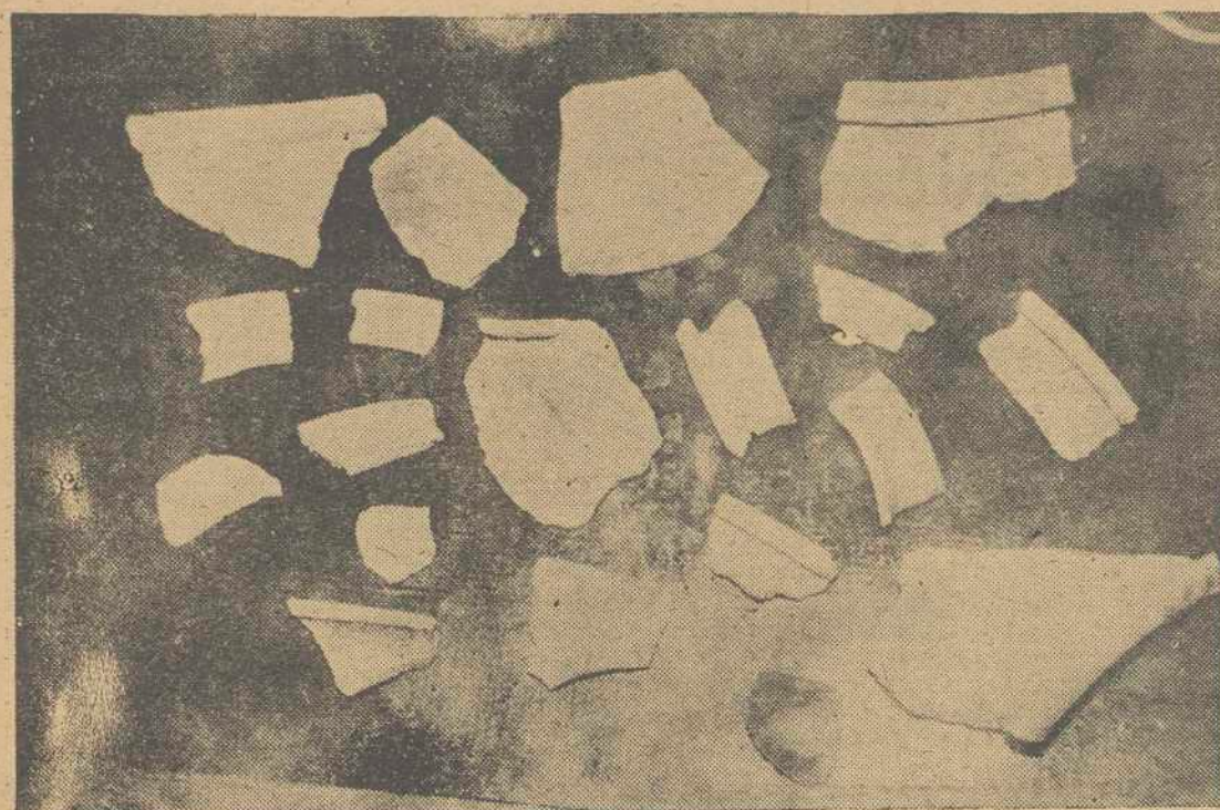
Restos de cerámicas que se han encontrado en el lugar en que estuvo emplazada la ciudad de Laminio.

Con su localización se podrá estudiar el trazado de todas las vías romanas de la Península