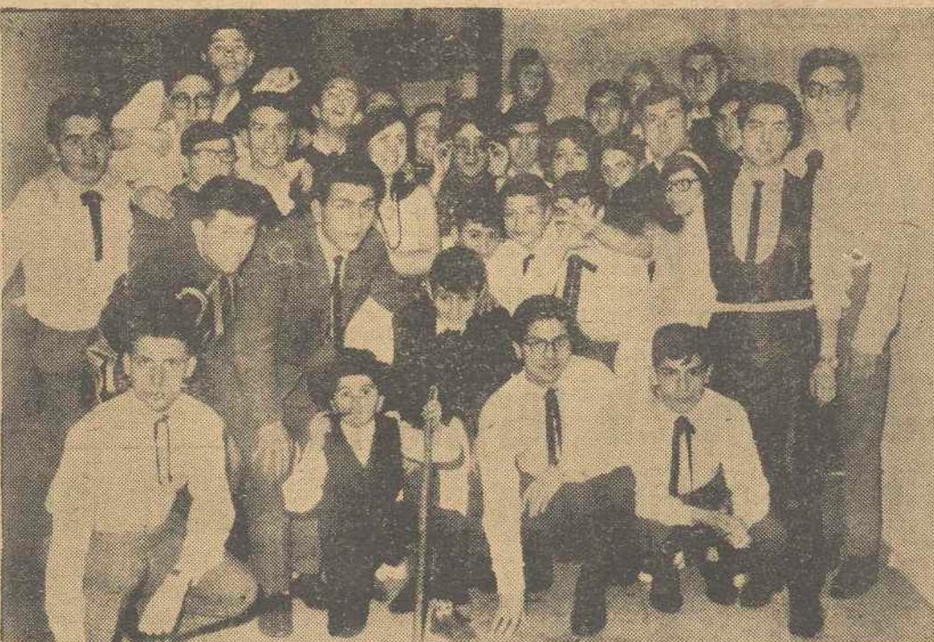
Artistas noveles que llegaron triunfadores a la gran final del popular concurso "Camino de la Fama", que organiza la Emisora de la REM "La Voz de Ferrol". — (Información en página interior)