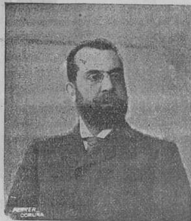
Excmo. Sr. D. Augusto González Besada Diputado á Córtes, Ex-ministro de Hacienda, 11 Gobernación y Fomento.

...Y hubo quienes, al ver los luminares que alumbraban tu espléndida carrera, murmuraron con ira, que tu esfera la dilató la suerte en sus azares. ¡Insensatos! Si cuando te elevares fueran quizás tus alas frágil cera, ya derretido tu poder cayera del Egeo político en los mares. Mas nó; que tu talento se ajiganta y el corazón te inflama el pensamiento; y así, al volar con rapidez que encanta, talento y corazón te dan su aliento, que si el talento el alma te abrillanta, tu corazón encumbra tu talento.